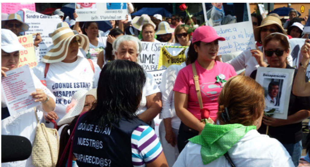
Familiares de personas desaparecidas durante la marcha del día de la madre, Ciudad de México

60%. En noviembre, a petición de PBI y otras organizaciones de derechos humanos, cinco expertas independientes formaron una Misión de Observación Civil para una visita a México. Luego de encontrarse con sociedad civil y autoridades de los tres niveles gobierno en los estados de Guerrero, Oaxaca, Baja California y en el Distrito Federal, confirmaron que la realidad de las personas defensoras de derechos humanos en México sigue marcada por la falta de reconocimiento, la criminalización y la impunidad 4 .