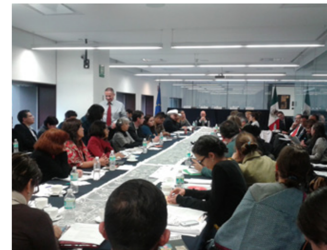
Celebración de los 10 años de las directrices de la Unión Europea para personas defensoras de derechos humanos, Ciudad de México

En marzo de 2014, el Mecanismo de Protección para Personas Defensoras de Derechos Humanos y Periodistas perdió un tercio de su personal, incluido su coordinador, y el rezago en el análisis de casos se acentuó. PBI alertó a su red de apoyo con una carta abierta junto con otras organizaciones internacionales a las autoridades mexicanas y a la comunidad internacional. En consecuencia, dos europarlamentarias expresaron su preocupación a través de una pregunta parlamentaria y cuatro parlamentarios alemanes mandaron cartas a las autoridades mexicanas. Otras ONGs internacionales también mandaron cartas y publicaron comunicados de alerta. Tras su reunión de abril, la Comisión Parlamentaria Mixta UE-México, a través de un co-