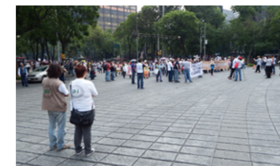
Voluntarios del Equipo Norte acompañan la marcha del día de la madre, Ciudad de México, Mayo de 2014

Esmeralda 106 Lomas del Crestón 68024 Oaxaca de Juárez Oaxaca oaxaca@pbi-mexico.org