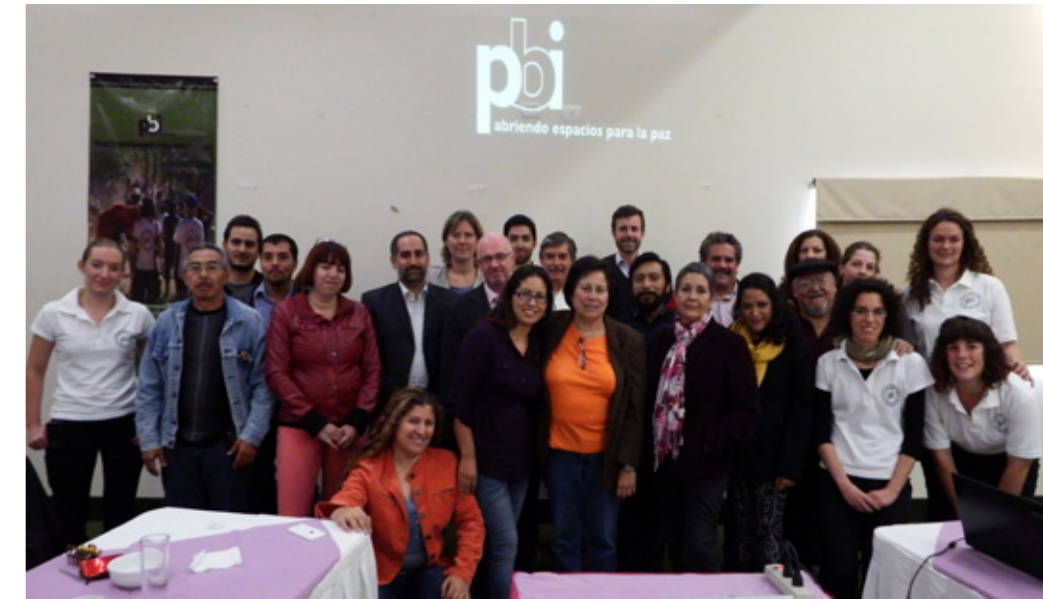
Personas defensoras y cuerpo diplomático participan en el evento de aniversario del Equipo Norte en Ciudad Chihuahua

Durante la Asamblea se aprobó el nuevo plan estratégico trienal (2015-17) del Proyecto México, que dará continuidad al desarrollo de los últimos años y que hace especial énfasis en el objetivo de aumentar la flexibilidad, tanto para poder apoyar aún mejor las personas en los estados en los