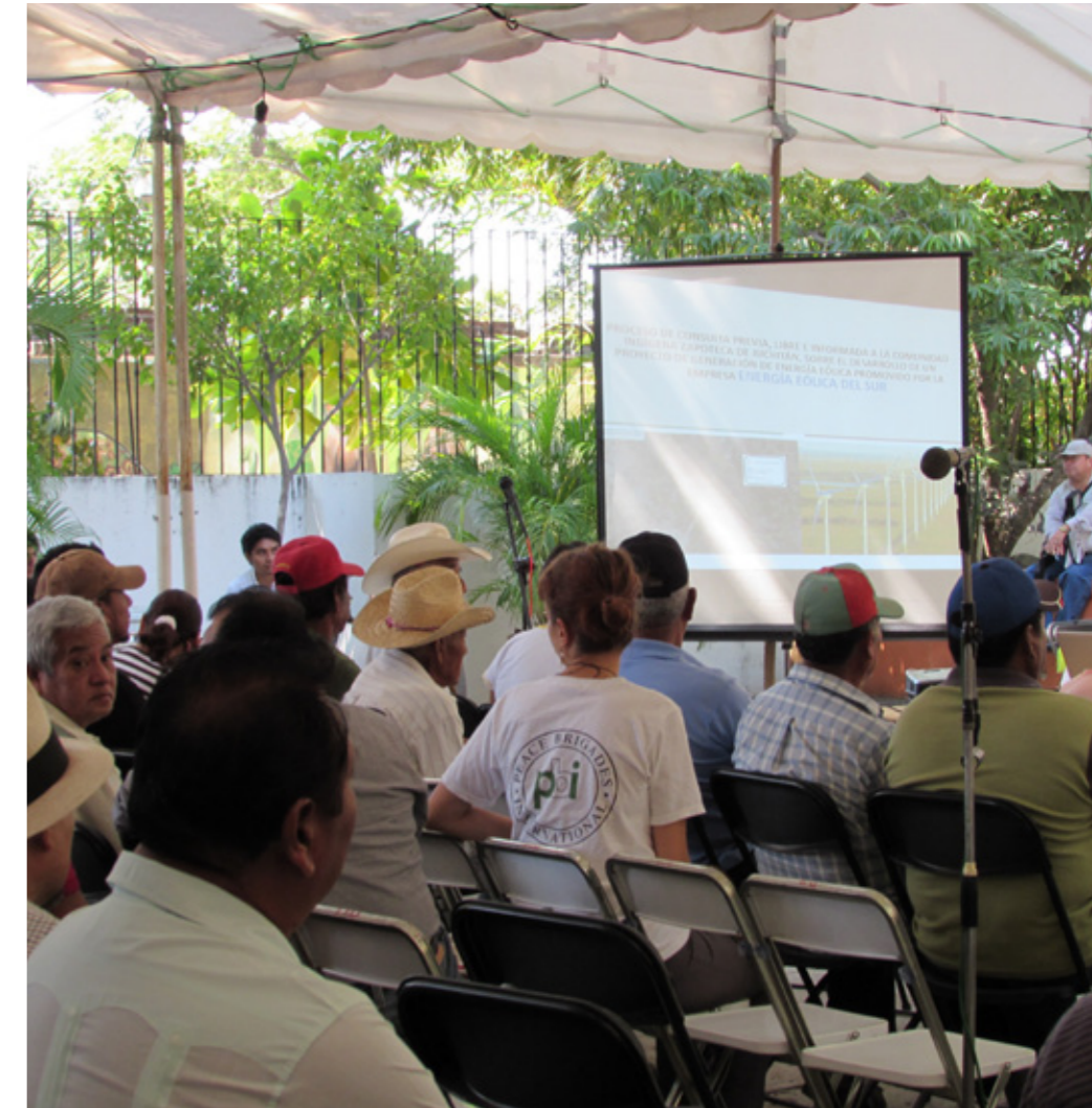
Voluntaria del Equipo Oaxaca observa la consulta popular en Juchitán de Zaragoza

El documento, publicado en noviembre, resalta además incidentes de seguridad