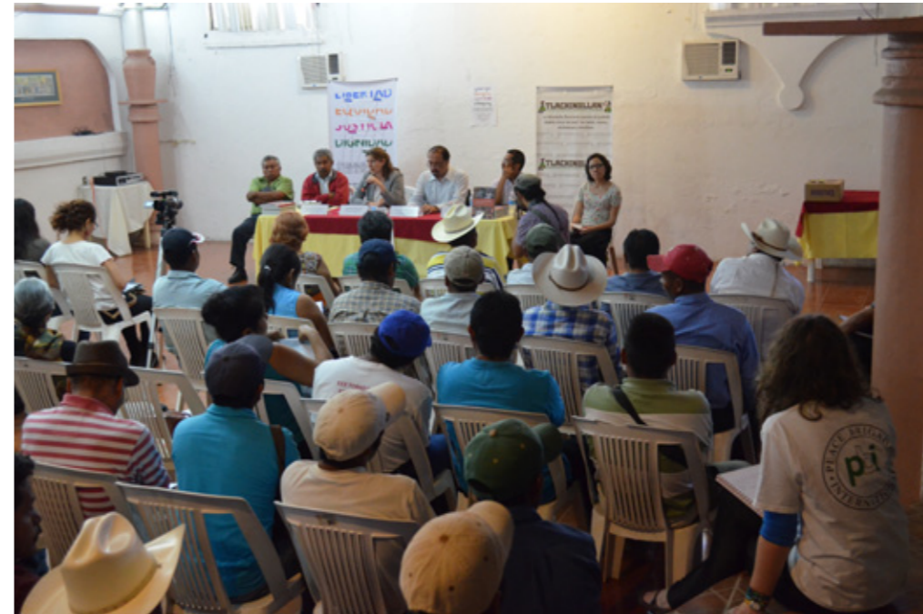
Integrante de PBI durante la presentación del libro "Acompañando la Esperanza" en Chilpancingo, Guerrero, febrero de 2014

En Ginebra, a través de reuniones con personas y oficinas clave de los procedimientos especiales de la ONU, del Alto Comisionado para los derechos humanos y del Comité contra las Desapariciones Forzadas, PBI respaldó las peticiones que Tlachinollan junto con otros aliados como el Centro de DDHH Miguel Agustín Pro Juárez ya habían hecho oficialmente. Como resultado de esta acción conjunta, los relatores especiales contra la tortura, ejecuciones extrajudiciales y el grupo de trabajo sobre las desapariciones forzadas mandaron un llamado urgente al Gobierno mexicano y publicaron un comunicado de prensa 31 . El Comité también emitió una acción urgente.