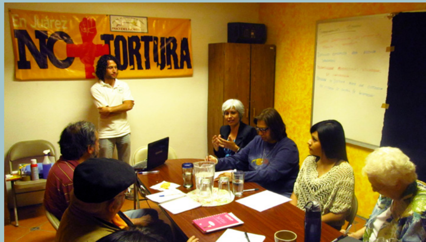
Integrantes del CDH Paso del Norte durante taller de incidencia impartido por PBI, Ciudad Juárez

En septiembre de 2013, PBI firmó su primer convenio de acompañamiento en el norte de México con el Centro de Derechos Humanos Paso del Norte (CDHPDN). Ubicado en Ciudad Juárez, el Centro se dedica a la defensa de víctimas de tortura y desaparición 8 . En 2011, la organización fue víctima de un allanamiento ilegal a sus oficinas por parte de integrantes de la Policía Federal y, en ocasiones ulteriores, varios integrantes del centro fueron blanco de hostigamiento, amenazas y vigilancia por parte de autoridades federales y estatales. A lo largo del año 2014, el acompañamiento de PBI estuvo enfocado en brindar mayor seguridad y legitimidad al CDHPDN, a través de interlocución con autoridades, asesorías en seguridad e incidencia, visibilización, fortalecimiento de redes de apoyo y acompañamiento físico. El resultado del año es positivo ya que se registró una considerable disminución de los incidentes de seguridad en contra de los integrantes del CDHPDN.