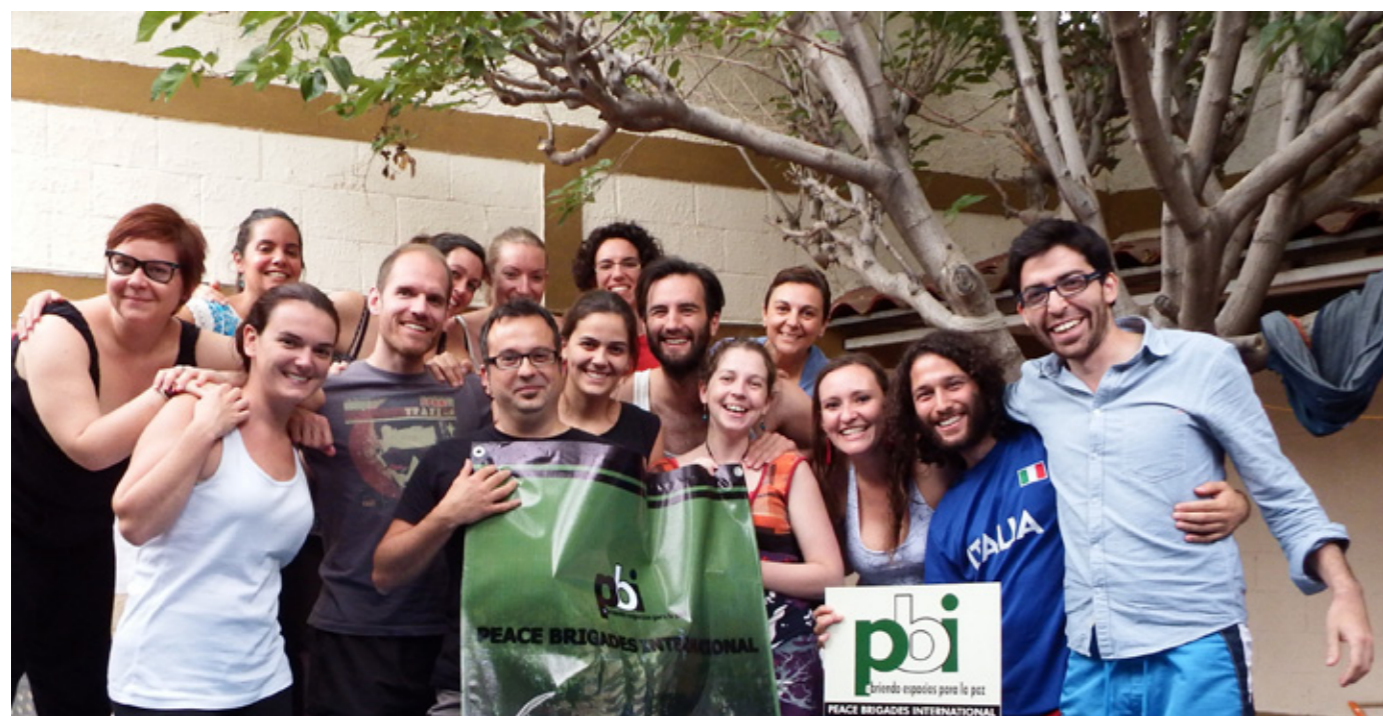
Integrantes de PBI México durante la reunión estratégica semestral en Ciudad Chihuahua

Algo más que se ha mantenido e, incluso, ampliado es la confianza que se brinda a las personas voluntarias. Exigimos mucho de nuestras voluntarias y voluntarios pero también brindamos una experiencia que, desde mi perspectiva, pocas organizaciones ofrecen. Ya en mi tiempo como voluntario me atrajo la oportunidad que PBI da a las personas voluntarias de construir experiencia en el terreno al lado de las personas defensoras con la posibilidad de aprender muchísimo y realmente hacer el trabajo que en otras organizaciones sólo permiten hacer a personas con un perfil de especialista, como actividades de incidencia o elaboración de publicaciones. La gama de actores que se llega a conocer en un año de voluntariado de PBI y el potencial de crecimiento personal y de desarrollo de capacidades profesionales es muy grande si uno sabe aprovechar bien las oportunidades y retos que ofrece el voluntariado de PBI.