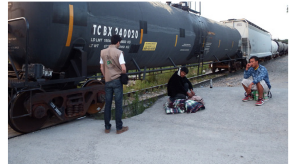
Voluntario del equipo norte con jóvenes migrantes en los alrededores de la Casa del Migrante de Saltillo

Asimismo, PBI celebró un año de presencia en Chihuahua y Coahuila el 6 de noviembre 2014 con un evento 12 en la ciudad de Chihuahua. Defensores de ambos estados entablaron un diálogo directo con representantes de cinco embajadas europeas. En aquel encuentro destacaron la grave inseguridad que reina para ellos en Chihuahua, particularmente en la Sierra Tarahumara, así como la falta de diálogo entre la sociedad civil y el gobierno. También hablaron de la lucha continua y peligrosa por localizar con vida las miles de personas desaparecidas de Coahuila, así como la dificultad de asegurar los derechos de los migrantes en un contexto de difamación y amenazas. Uno de los resultados de este evento fue una reunión