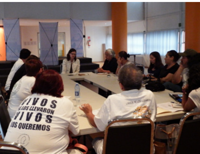
Organizaciones civiles y embajada de Estados Unidos abordan problemática de desapariciones forzadas en reunión facilitada por PBI, Ciudad de México

Durante el 2014, el trabajo de cabildeo de PBI se ha enfocado en abrir espacios de diálogo y canales de comunicación entre la sociedad civil mexicana y las autoridades mexicanas, el cuerpo diplomático y la comunidad internacional con el fin de garantizar la integridad física y psicológica de personas defensoras de derechos humanos en México. Los esfuerzos de esta incidencia se han concentrado, sobre todo, en tres áreas temáticas: (1) Empresas y Derechos Humanos, (2) Seguridad, Justicia e Impunidad e (3) Implementación de las Medidas de Protección.