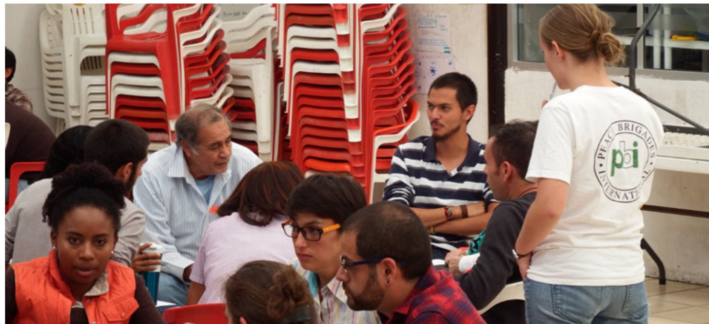
Voluntaria del Equipo Norte durante taller de seguridad con integrantes de la Casa del Migrante de Saltillo

Durante el 2014, PBI tomó también la iniciativa de invitar al Comité Cerezo a Ciudad Juárez y a Torreón, donde brindaron un taller de documentación de violaciones de derechos humanos a 36 personas defensoras de 14 organizaciones del norte del país. Con esto, el impacto fue doble: por un lado se reforzó la construcción de relaciones en el seno de la sociedad civil mexicana y por otro, se abrió una oportunidad para aumentar las capacidades de un grupo importante de personas defensoras.