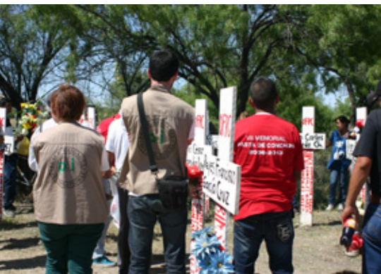
Voluntarios del Equipo Norte acompañan a la organización Familia Pasta de Conchos en memorial por desastre minero en el Pozo 3 de BINSa

El Informe Anual 2014 de PBI México ha sido financiado por el Instituto de Relaciones Internacionales (ifa), Programa zivik (Civil Conflict Resolution) del Ministerio de Asuntos Exteriores de Alemania