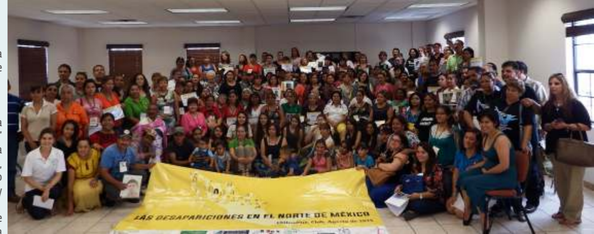
Representantes de OSCs, familiares de desaparecidos y voluntarios de PBI durante el encuentro regional norte sobre desapariciones en México