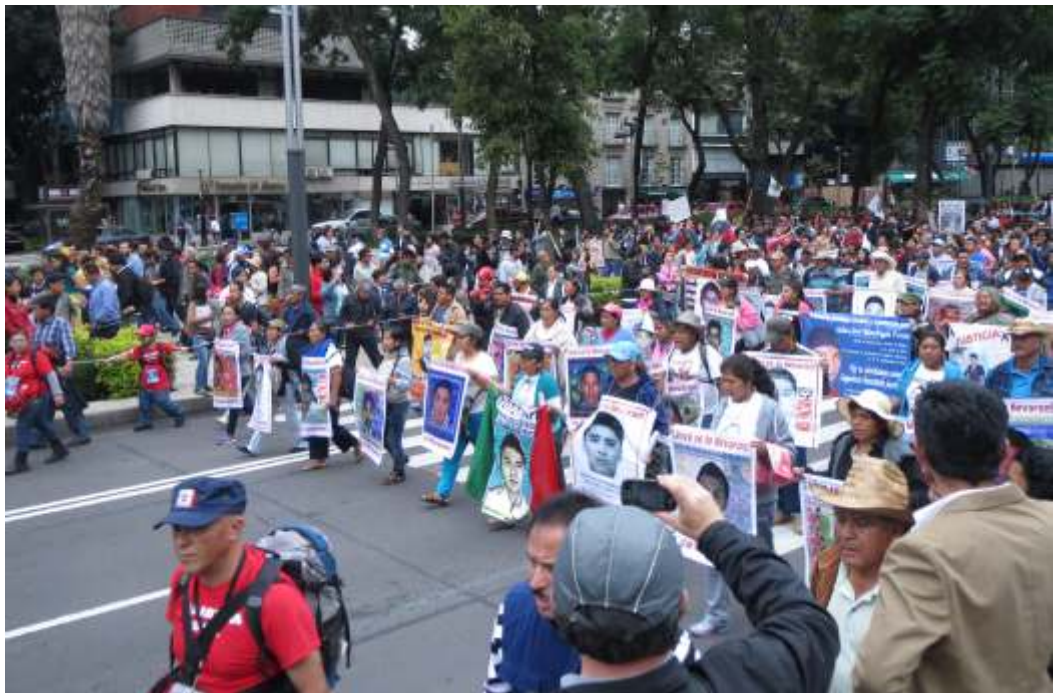
Familiares de los estudiantes de Ayotzinapa desaparecidos en septiembre de 2014 durante marcha en la Ciudad de México

A inicios del año PBI presentó un informe donde destacaba que, a pesar del discurso oficial, no se ha observado un "México en Paz" durante los primeros dos años de gobierno de Enrique Peña Nieto, sino que se mantienen los impactos preocupantes de las políticas de seguridad pública sobre el respeto de los derechos humanos. Añadía también que en cuanto a la Iniciativa Mérida "el Congreso de los Estados Unidos tiene la capacidad de retener el 15% de los fondos si México no cumple con estándares mínimos de respeto a los derechos humanos", lo que ocurrió por primera vez en 2015 ya que según el Departamento de Estado no han "sido capaces de confirmar que México cumple totalmente los criterios especificados".