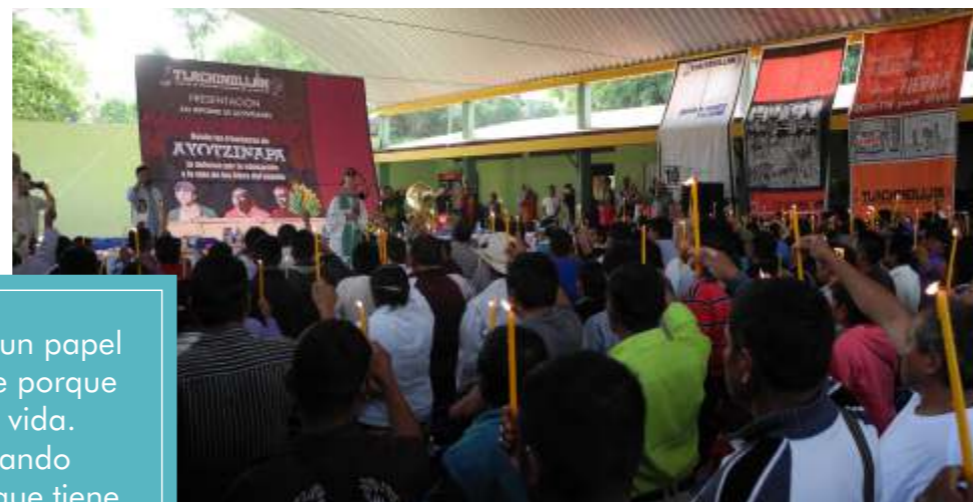
Familiares de los estudiantes Ayotzinapa durante el aniversario de Tlachinollan en 2015

"PBI ha jugado un papel muy, muy fuerte porque arriesgan su vida. Están afrontando a un gobierno que tiene mucho poder" Valentina Rosendo Cantú