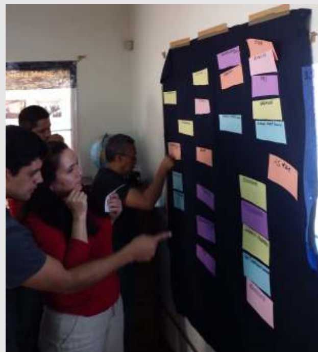
Integrantes de ASMAC durante taller de incidencia política impartido por PBI

El proyecto culminó con varias mesas redondas y encuentros de alto nivel, a destacar un evento que contó con la presencia del Relator Especial sobre la Situación de los Defensores de Derechos Humanos, Michel Forst. El Relator expresó su satisfacción por dicho proyecto, y se comprometió a apoyar en la distribución y difusión de las herramientas. En septiembre 2015, 21 defensoras -alumnas del curso- participaron en una mesa redonda con 14 representantes del cuerpo diplomático en México, donde extendieron sus recomendaciones sobre la aplicación de las directrices de la UE sobre defensores de derechos humanos con énfasis en las medidas de prevención. A parte del apoyo político brindado, la Unión Europea ha financiado dicho proyecto.