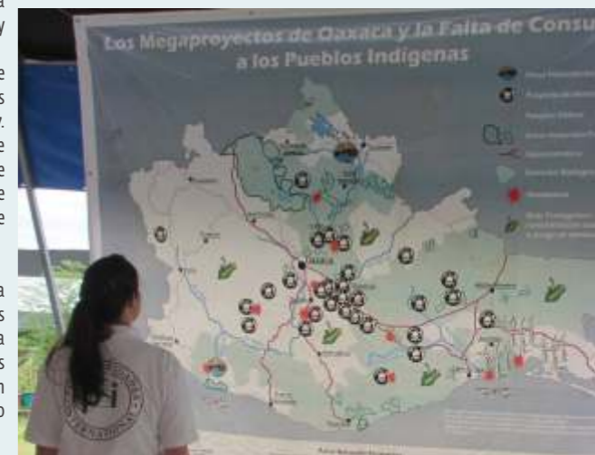
Voluntaria de PBI observa mapa de megaproyectos en Oaxaca

Entre noviembre de 2014 y julio de 2015, PBI observó varias sesiones de la Consulta sobre la construcción de un parque eólico en Juchitán. Siempre conforme a sus principios de no-violencia, no-injerencia y no-partidismo, PBI procuró evitar ataques contra las personas defensoras involucradas en el proceso y visibilizar el respaldo de la comunidad internacional hacia ellas. El 30 de julio se cerró la fase consultiva con la aprobación del proyecto pero en septiembre un juez federal otorgó una orden de suspensión temporal de la construcción, la cual fue confirmada en diciembre por una suspensión definitiva del proyecto. Organizaciones sociales lo consideraron un logro importante para los pueblos indígenas del Istmo. PBI sigue pendiente del desarrollo de este asunto y en particular de la seguridad de los defensores comunitarios que han luchado contra la implementación del parque eólico y que por eso han sufrido amenazas y hostigamientos documentados en los reportes de la misión de observación de la consulta. Por último, cabe destacar que PBI busca contribuir a la visibilización internacional del trabajo de los defensores comunitarios y, con ese fin en mente, en el documental "Tierra del Maíz" resaltó el caso de los proyectos eólicos del Istmo de Tehuantepec. Al respecto, Alba Cruz de Código DH consideró que "la visibilización ha sido fundamental en momentos difíciles y en el Istmo ha sido parte de aminorar el riesgo".