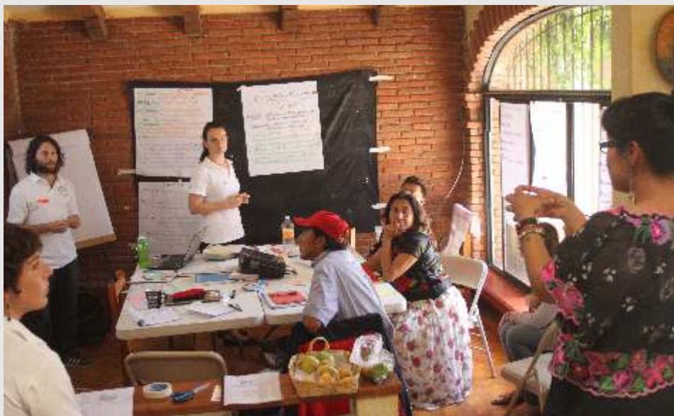
Equipo de PBI imparte taller de incidencia política a Código-DH y a la APPJ

El constante riesgo que durante 2015 enfrentaron las personas defensoras de derechos humanos mexicanas, representó desafortunadamente, un escenario propicio para que Organizaciones de la Sociedad Civil (OSCs) se siguieran acercando a PBI con peticiones de asesorías en seguridad y protección. Llama la atención de forma preocupante que varias organizaciones señalaron en sus peticiones, la necesidad de prevenir y establecer estrategias de reacción ante posibles allanamientos y robos en sus oficinas. Esta tendencia vino marcada por varios robos sufridos en domicilios y oficinas de personas defensoras acompañadas por PBI. A estas peticiones que cada vez más llegaron de movimientos sociales y defensores comunitarios, PBI respondió con 8 talleres de seguridad que beneficiaron directamente a 87 personas defensoras. Adicionalmente, se brindaron 14 asesorías en seguridad y protección y nuestra Guía de Facilitación para replicar talleres de seguridad fue descargada más de 700 veces. 1