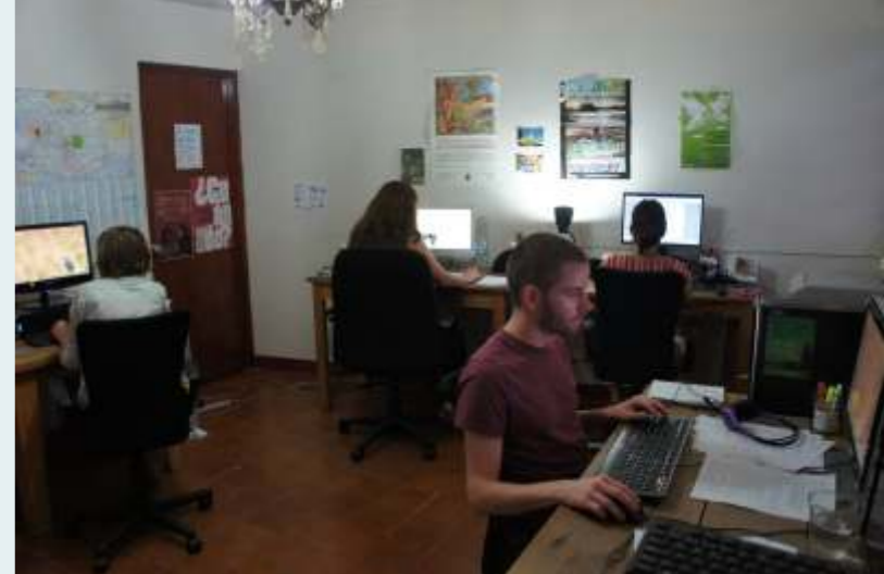
Voluntarios de PBI en la oficina de Oaxaca en 2014