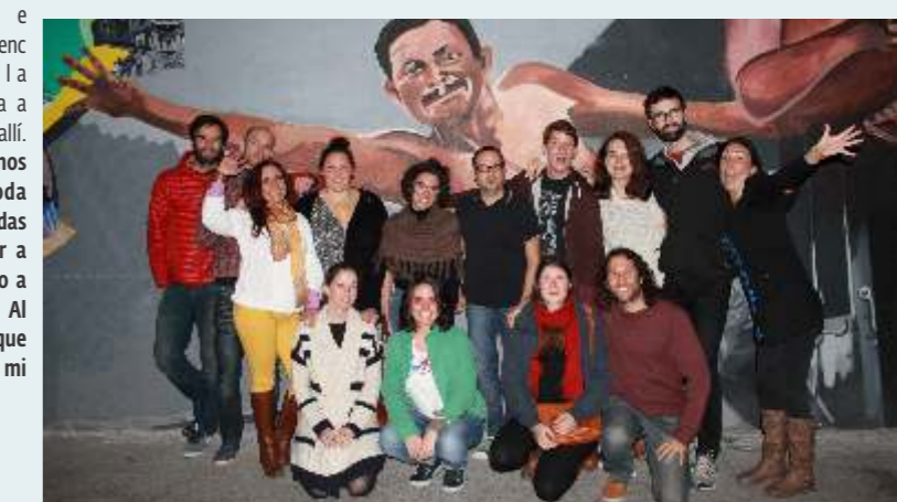
Equipo de trabajo de PBI durante reunión del proyecto en 2015

Manon Yard: El ejemplo de los defensores que acompañamos y que siguen luchando por el respeto de los derechos humanos a pesar de todas las amenazas, agresiones, frustraciones o decepciones sigue siendo indudablemente una gran guía para mí.