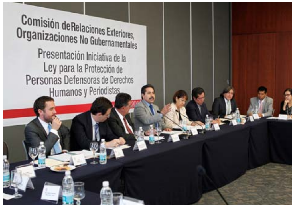
Presentación de la iniciativa de la Ley para la Protección de Personas Defensoras de Derechos Humanos y Periodistas

El Proyecto México quiere así responder a las peticiones de la sociedad civil y a la coyuntura actual, caracterizada por la violencia generalizada, las disputas entre grupos criminales y el Estado mexicano, que siguen generando cifras espantosas de víctimas de asesinatos, desapariciones forzadas y otros crímenes en la población de México 1 . Es también un contexto en el que la militarización como política de lucha contra el crimen organizado no ha disminuido la inseguridad, al contrario, el despliegue del ejército y otras fuerzas públicas ha llevado a un aumento preocupante de fuertes violaciones de derechos humanos documentadas por organizaciones nacionales e internacionales 2 . Esta