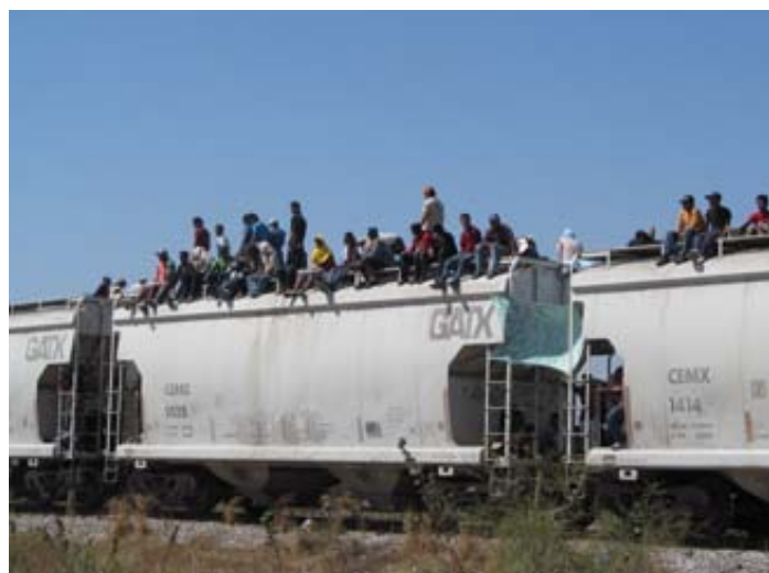
“La bestia” en su ruta por el Istmo de Tehuantepec (Oaxaca)

Estas mismas autoridades recibieron cartas de preocupación de la red de apoyo de PBI en distintos países. Seis embajadas en México invitaron a personas defen-