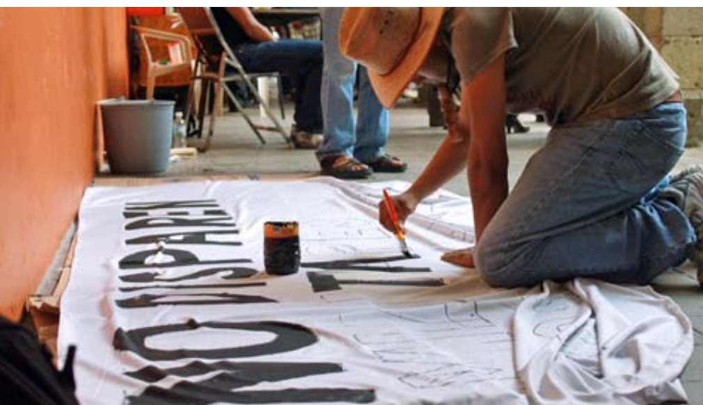
“No disparen”, durante un acto del Movimiento por la Paz con Justicia y Dignidad

Estas dos temáticas ponen de relieve la actuación de actores no estatales como perpetradores de ataques en contra de las personas defensoras y confirma la tendencia observada a nivel internacional por el Relator Especial de la ONU para los Defensores de Derechos Humanos 11 . En PBI, esta situación nos ha impulsado a reflexionar sobre nuestro modelo de protección 12 ; es claro que el marco legal internacional actual mantiene la responsabilidad sobre los Estados como sujetos y actores principales del derecho internacional. El Estado mexicano debe prevenir, proteger y responder a las agresiones contra las y los defensores ante la actuación de sus propios agentes, pero también ante las acciones de perpetradores no estatales 13 ; más aún si conoce el ostensible estado de riesgo en el que se encuentran estas personas, denunciada por organizaciones nacionales y organismos internacionales 14 . Queda por ver si el nuevo sexenio cumplirá con la protección a las personas defensoras de derechos humanos. México necesita más que nunca de su labor.