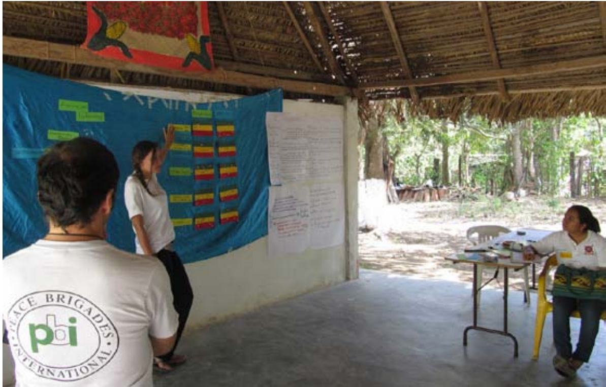
PBI durante un taller de seguridad en Oaxaca

PBI priorizó a las organizaciones con capacidad de generar un efecto multiplicador y,