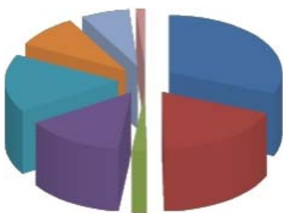
Gráfico gastos (Outcome)

Callejón del Carmen 103 Fracc. La Paz 68000 Oaxaca de Juárez Oaxaca oaxaca@pbi-mexico.org