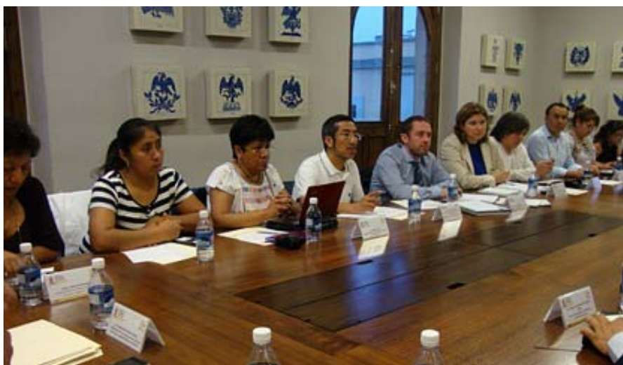
Misión de observación de la situación de las personas defensoras de derechos humanos en Oaxaca convocada por PBI México y la Red TdT

Cabe destacar el caso relacionado con la mina de San José del Progreso (Valles Centrales), donde dos integrantes de la organización Coordinadora de Pueblos Unidos del Valle de Ocotlán (COPUVO) fueron asesinados en el último año, y el de los parques eólicos en Unión Hidalgo y San Dionisio del Mar, donde líderes comunitarios denunciaron amenazas de muerte, agresiones físicas y tortura 35 . Dos organizaciones acompañadas por PBI, Comité de Defensa Integral de Derechos Humanos "Gobixha", A.C. (Codigo-DH) y Centro Regional de Derechos Humanos "Bartolomé Carrasco Briseño", A.C. (Barca-DH), trabajan sobre estos casos; el Proyecto México acompañó a sus integrantes en misiones civiles de observación a las comunidades afectadas para disuadir agresiones en contra de las y los activistas. PBI también ha llevado a cabo acciones puntuales para otras organizaciones como la Asamblea de Pueblos Indígenas del Istmo de Tehuantepec y Servicios Para una Educación Alternativa, A.C. (EDUCA), y continúa sensibilizando dentro y fuera de México sobre el derecho a la consulta y el peligro de defenderlo en México, particularmente en el estado de Oaxaca.