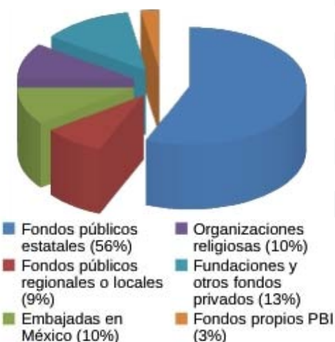
Gráfico ingresos (Income)

Los datos financieros en este informe son provisionales y no han sido aún auditados. Todos los gastos e ingresos presentados están en USD.