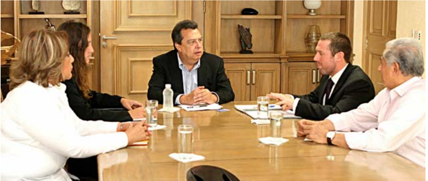
Ben Leather e Ivi Oliveira se reúnen con el Gobernador de Guerrero Ángel Aguirre Rivero

PBI México se ha mantenido fiel a sus objetivos de protección a personas defensoras de derechos humanos en México, manteniendo la incidencia sobre la puesta en marcha del Mecanismo de Protección. La aprobación de la ley y la instalación de la Junta de Gobierno han sido dos de los pasos más importantes al respecto y PBI ha sido testigo directo de estos avances. Pero el Proyecto también ha enfocado su estrategia de cabildeo en otros asuntos como la especial protección y la visibilización de la labor de las mujeres defensoras en México o la situación de riesgo de las personas defensoras en Oaxaca. El apoyo de actores internacionales, tanto fuera como dentro de México, ha sido uno de los pilares del trabajo de PBI durante 2012.