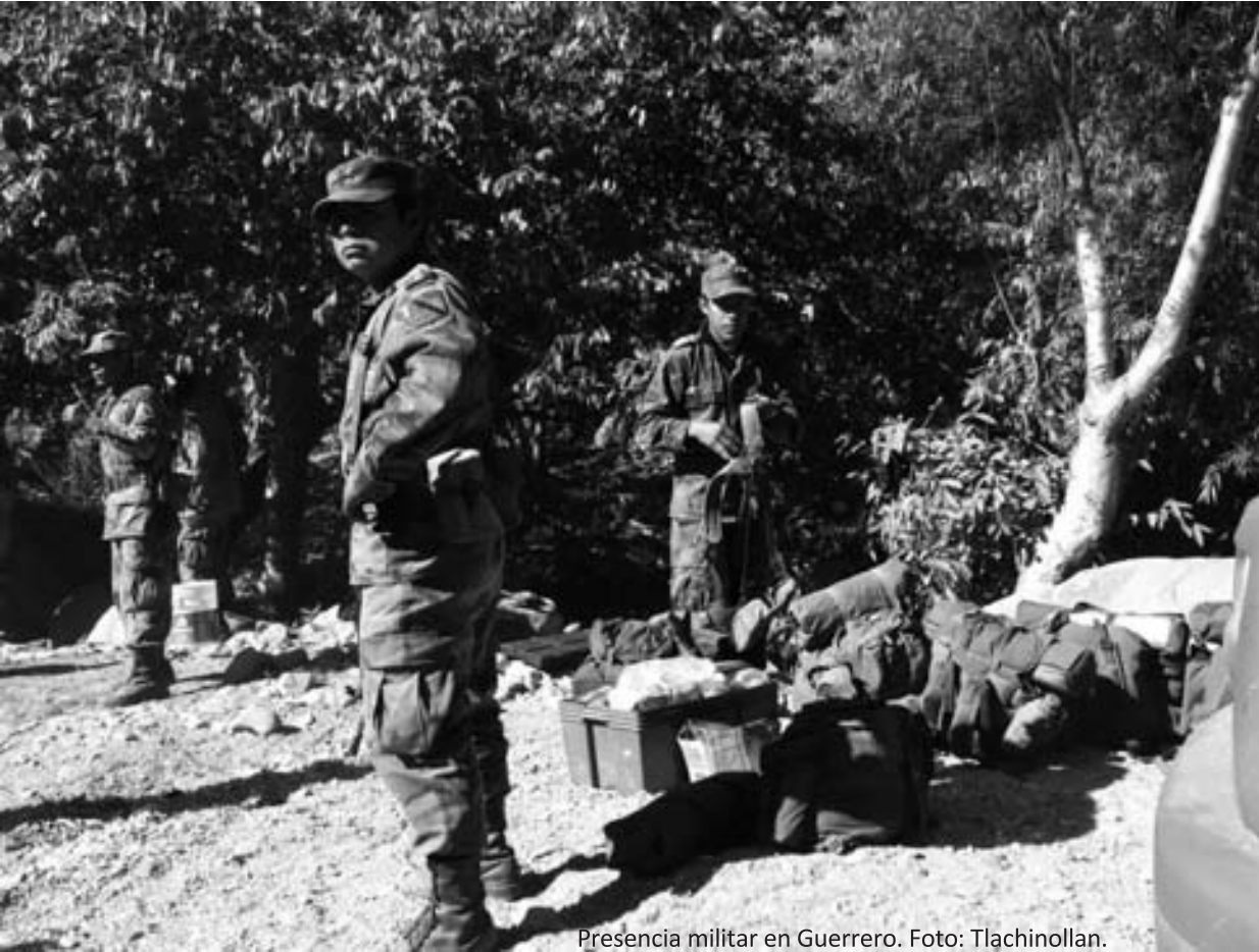
Presencia militar en Guerrero.

jurisdicción militar sólo debe conocer de “delitos o faltas que por su propia naturaleza atenten contra bienes jurídicos propios del orden militar” y que “frente a situaciones que vulneren derechos humanos de civiles bajo ninguna circunstancia puede operar la jurisdicción militar” 26 . Señaló ade-