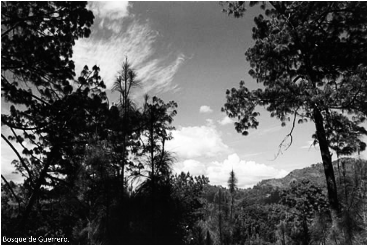
Bosque de Guerrero.

Al mismo tiempo que el activismo de los campesinos ecologistas logró una mayor protección de los bosques de Guerrero, repercutió en una mayor presencia del Ejército mexicano en la Sierra de Petatlán así como en la represión y asesinato de varios miembros de la OCESP como represalia por sus esfuerzos para impedir la tala ilegal e inmoderada 60 . En el