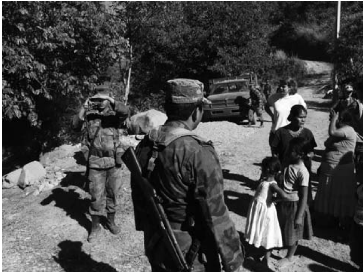
Presencia militar en Guerrero.

sonas. Y es que bajo el gobierno de Felipe Calderón la militarización se ha generalizado en todo el país. Bajo la premisa de combatir el crimen organizado a cualquier costo, los derechos humanos han sido ignorados. Se han flexibilizado al extremo los requisitos para realizar intervenciones telefónicas y cateos a domicilios particulares; la figura del arraigo se ha elevado a rango constitucional; y existe una definición de delincuencia organizada muy ambigua que propicia la