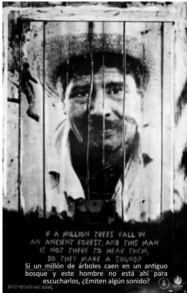
Cartel de "Defend the Earth".

origen en actos ocurridos durante administraciones anteriores a la de Felipe Calderón, la ausencia del acceso a la verdad, la justicia y la reparación integral configura una violación permanente de los derechos de las víctimas y corresponde a los poderes -ejecutivo, legislativo, judicial- de los tres niveles de gobierno, es decir al Estado en su conjunto, tomar las medidas adecuadas para revertir esta situación de injusticia. Por otro lado, ha sido durante el sexenio actual, en el que la Comisión Interamericana de Derechos Humanos, primera instancia del Sistema Interamericano, ha formulado una serie de recomendaciones al