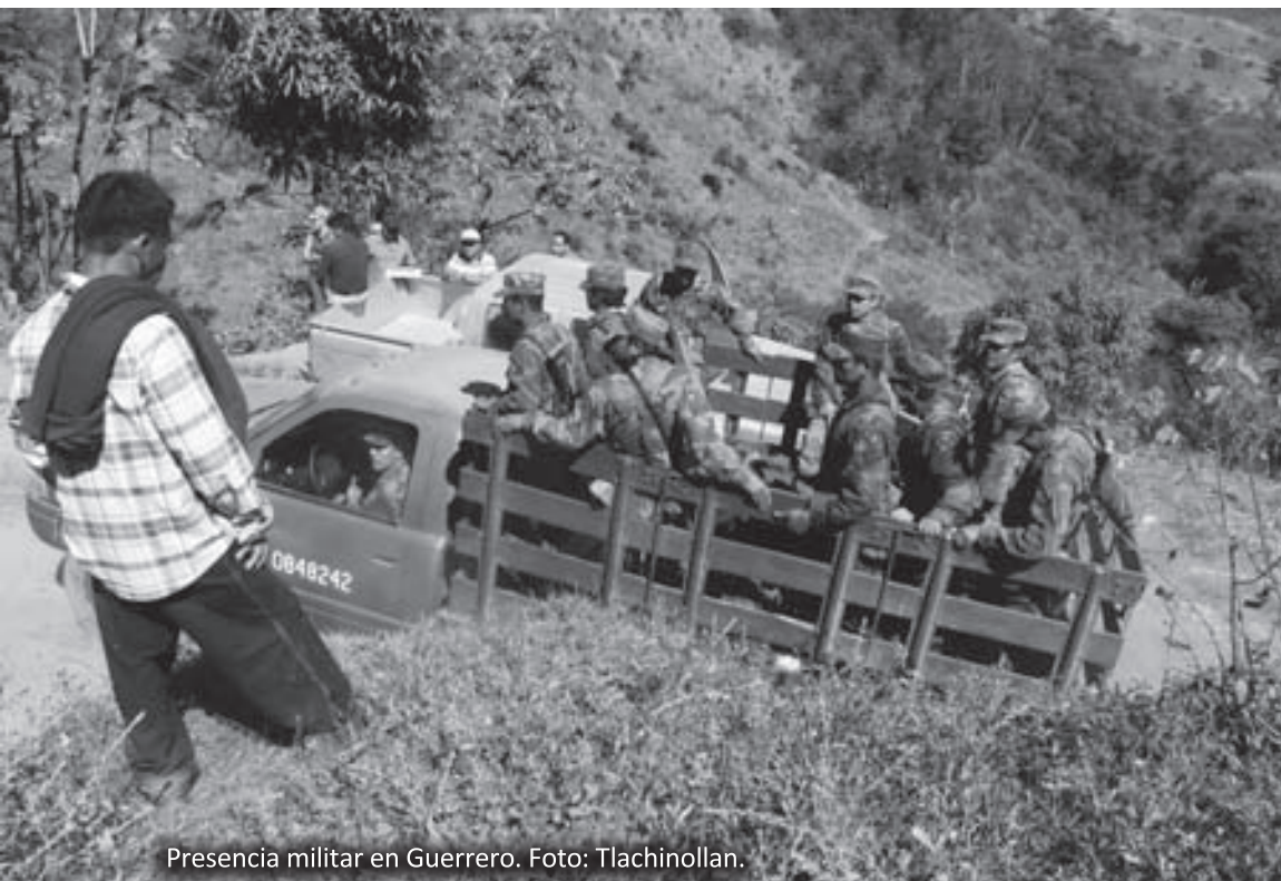
Presencia militar en Guerrero.

reivindicaciones colectivas por los derechos han sido una constante en Guerrero. A partir de la década de los sesenta, los pueblos campesinos e indígenas comprendieron que las estructuras políticas, de justicia y los cuerpos policiacos y militares mantenían una actuación facciosa en su perjuicio y a favor de los cacicazgos regionales que los pisoteaban y explotaban. Por ello su lucha social de ahí adelante se convirtió en política. Ante un espacio cerrado de participación política, optaron por la movilización pacífica.