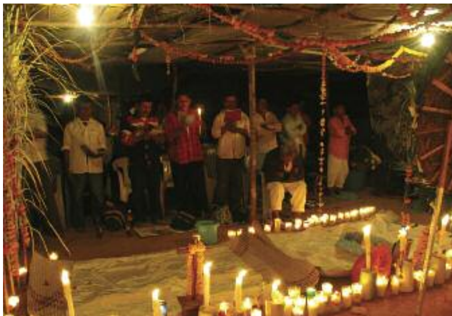
© Centro de Derechos Humanos de la Montaña Tlachinollan