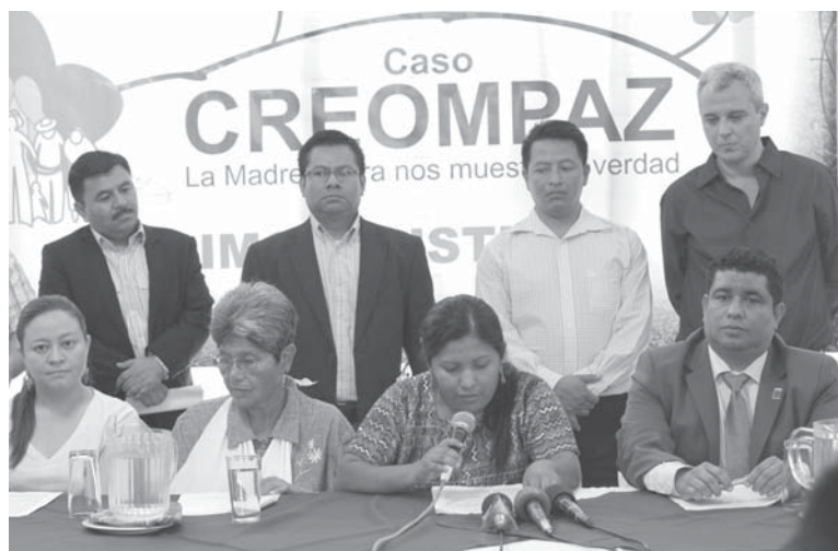
Rueda de Prensa de las organizaciones querellantes adhesivas del caso CREOMPAZ, Foto: PBI 2016.

Uno de los integrantes de AVECHAV, explica la razón por la que se constituyeron como testigos y querellantes adhesivos de la siguiente forma: en nuestra memoria vivimos esto, hemos sufrido, lo tenemos en la memoria, todos nosotros, lo tenemos y no se va a borrar nunca, es la verdad de lo que nos pasó. Nosotros lo que hemos sufrido lo decimos. Sobre todo esta verdad que ha sufrido Chicoyogüito