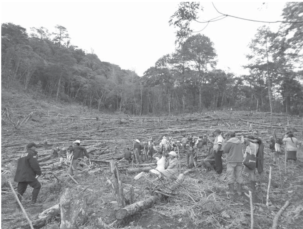
Verificación de la tala de árboles en la montaña de las Granadillas, Zacapa.

Bajo esta misma lógica, el Foro Permanente para las Cuestiones Indígenas de Naciones Unidas, en su informe de mayo de 2016 insta a Guatemala, al sector privado, al Banco Mundial y a otras instancias económicas internacionales a que reconozcan que las iniciativas serias encaminadas a cambiar radicalmente la situación de pobreza creciente y generalizada de los pueblos indígenas de Guatemala requieren reformas (...) que deben asegurar una distribución más equitativa y el acceso a las tierras tradicionales de los pueblos indígenas de Guatemala, de conformidad con los derechos enunciados en la Declaración de las Naciones Unidas y sobre la base del respeto y el reconocimiento jurídico de sus derechos colectivos, incluido el derecho al desarrollo basado en la libre determinación.