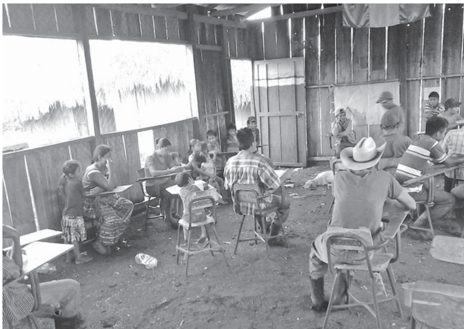
Reunión en una de las escuelas que construyeron los y las comunitarias. Escuela de la Comunidad Gloria Nueva Esperanza, en la Laguna del Tigre.

La ausencia de estos servicios agrava, especialmente, la situación de las mujeres y la niñez. En muchas ocasiones los niños no pueden estudiar porque van directamente a trabajar en la agricultura, mientras que las niñas se dedican a la cocina y a cuidar a sus hermanas y hermanos. Tal y como lo describe una mujer de