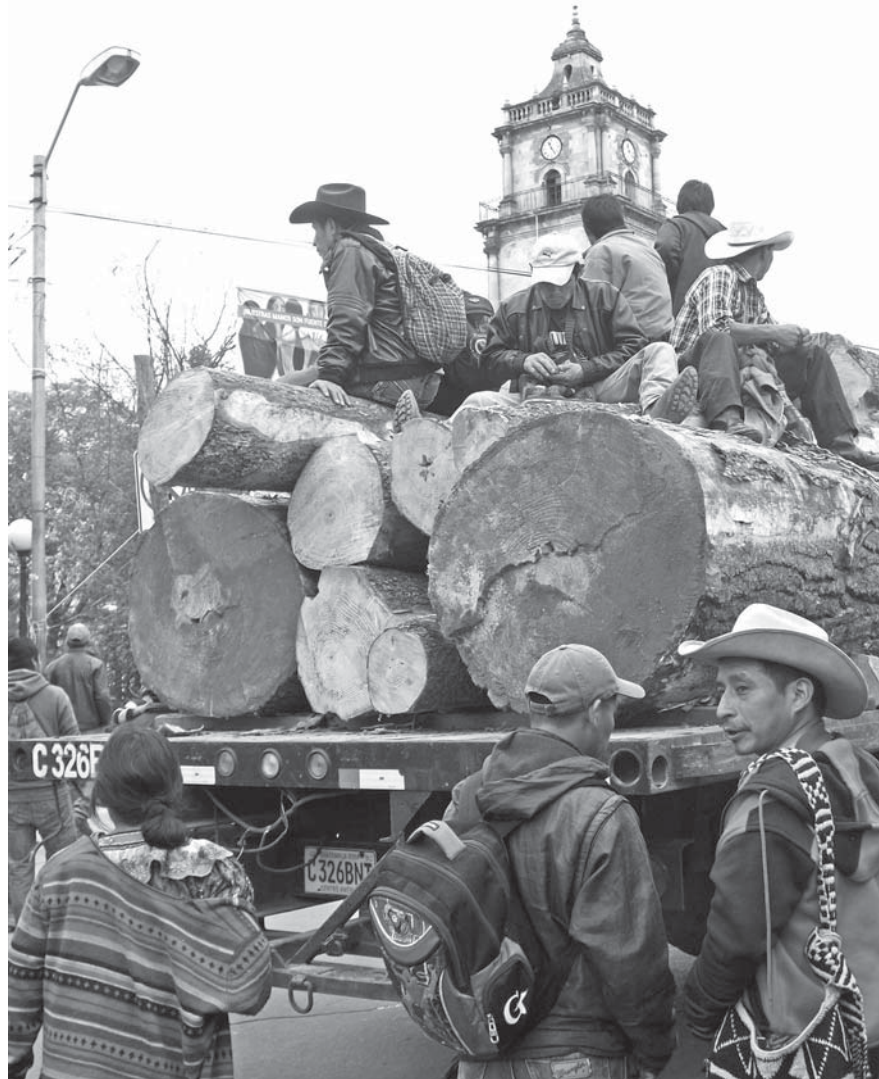
Miembros del CPK acompañan un camión que transportaba madera para pedir a las autoridades pertinentes la revisión de los permisos de tala.

En el artículo 126 de la Constitución Política de la República de Guatemala se declara de urgencia nacional y de