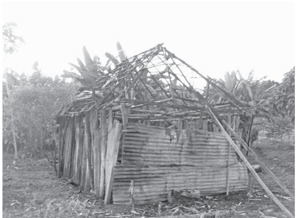
Quema de una casa a consecuencia de un desalojo forzoso en la Comunidad Nueva Esperanza, 2011, Sierra del Lacandón.

los controvertidos Acuerdos de Cooperación (AC), que según Domínguez han sido implantados de forma unilateral por el CONAP para tolerar la permanencia indefinida en estas áreas, en tanto se logra el desalojo. La lectura que las comunidades afectadas hacen sobre estos acuerdos es que son una negociación al derecho de vivir allá, una estrategia, porque con estos acuerdos se asume que la tierra no es de propiedad de las personas que vivimos allí y nos obligan a firmarlos porque sino nos desalojan. Nos tratan de invasores, usurpadores y nos criminalizan como grupo. Por ello, describen esta situación como una violación continua de sus derechos humanos. En este marco, hacen referencia al desalojo que tuvo lugar hace 7 años en la Comunidad Centro Uno y a sus consecuencias: Por falta de realojamiento y acceso a la tierra murieron personas por desnutrición, pero nunca se relacionó la muerte con el desalojo y estas violaciones a los