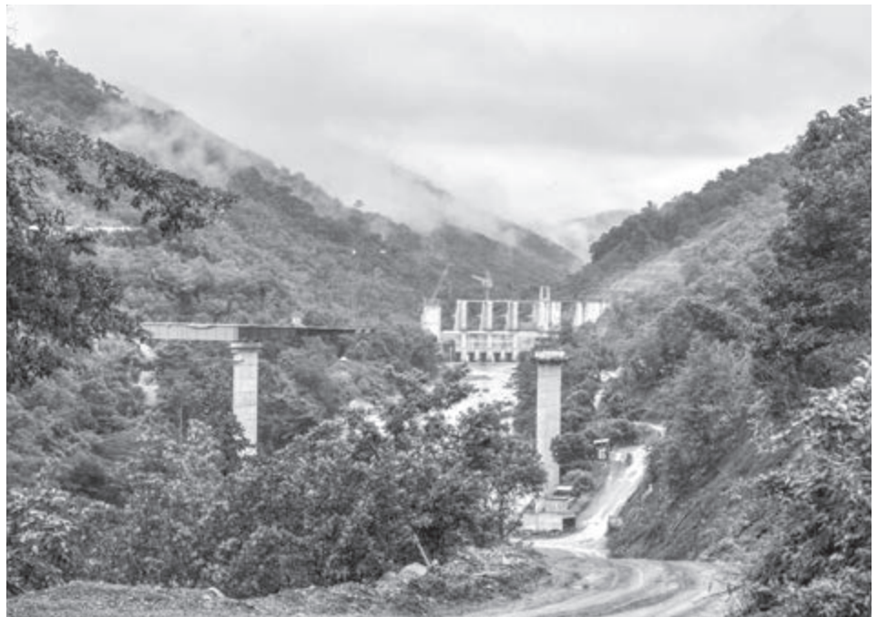
Panorámica hidroeléctrica Oxec. Guatemala, 12.05.2017.

PBI estuvo presente en la consulta comunitaria del 27 de agosto, de hecho este fue el inicio de nuestro acompañamiento a la Resistencia Pacífica de Cahabón.