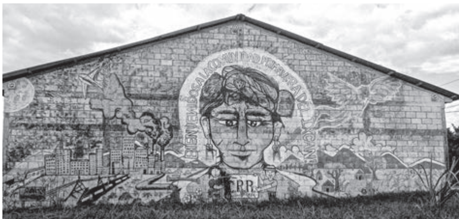
Mural en el salón comunitario de Primavera del Ixcán.