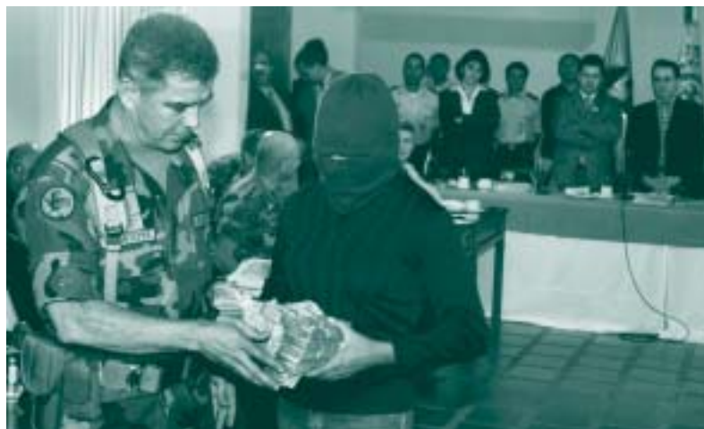
Un informante recibe una recompensa en metálico del general Mario Montoya en Medellín en una ceremonia televisada a la que asistieron altos cargos del gobierno, incluido el Presidente Uribe (al fondo, a la derecha).

naron este espectáculo tras convertirse en blanco de críticas generalizadas tanto nacionales como internacionales.