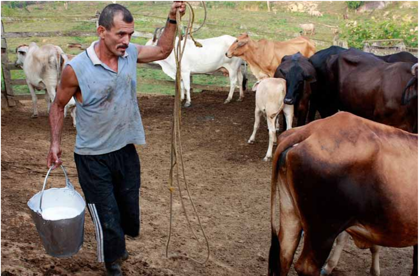
Campesino en la finca «La Cristilina» en el Noreste Antioqueño.

La ZRC tiene una extensión de 550.000 hectáreas, 370.000 de las cuales son Reserva Forestal. Para la ACVC el objetivo de la ZRC es el derecho a las tierras de la población de la zona, el derecho a la tenencia de la tierra y la prevención de nuevos desplazamientos forzados. Los miembros de la ACVC creen que: «El Es-