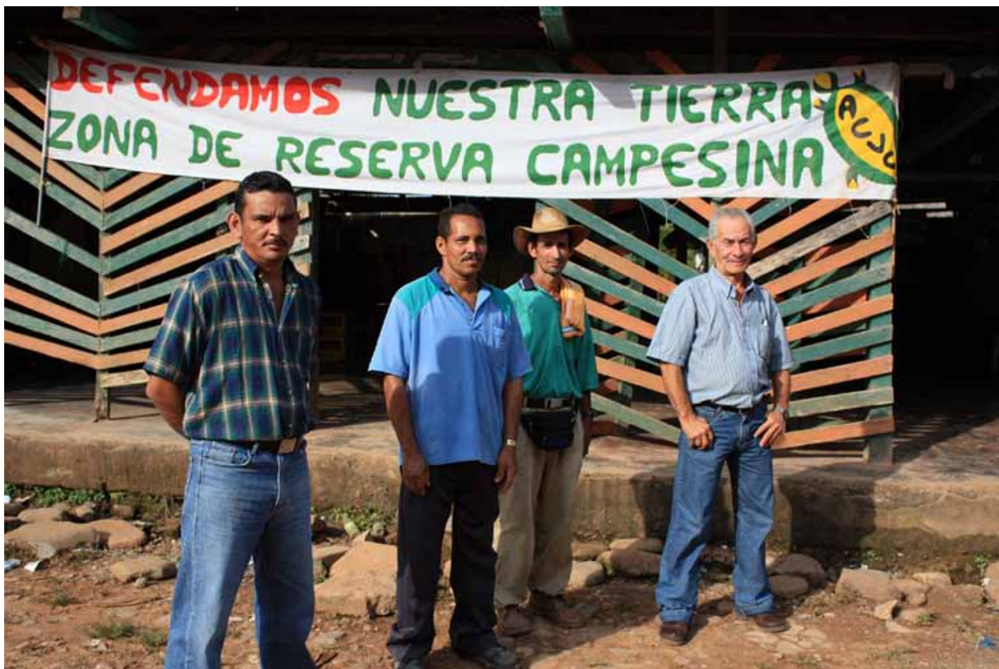
Miembros de la ACVC.