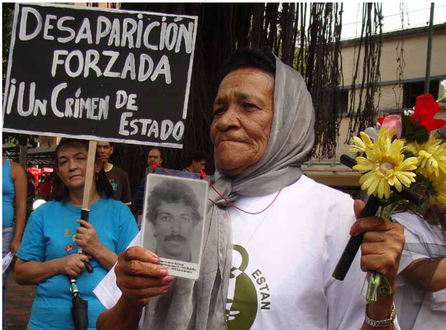
Acto de ASFADDES en Medellín contra la desaparición forzada.

La Asociación de Familiares de Detenidos-Desaparecidos (ASFADDES) es una ONG que desde 1982 lucha por el derecho a la Verdad, la Justicia y la Reparación Integral en Colombia. PBI acompaña a sus miembros desde que tiene presencia en el país en 1994.