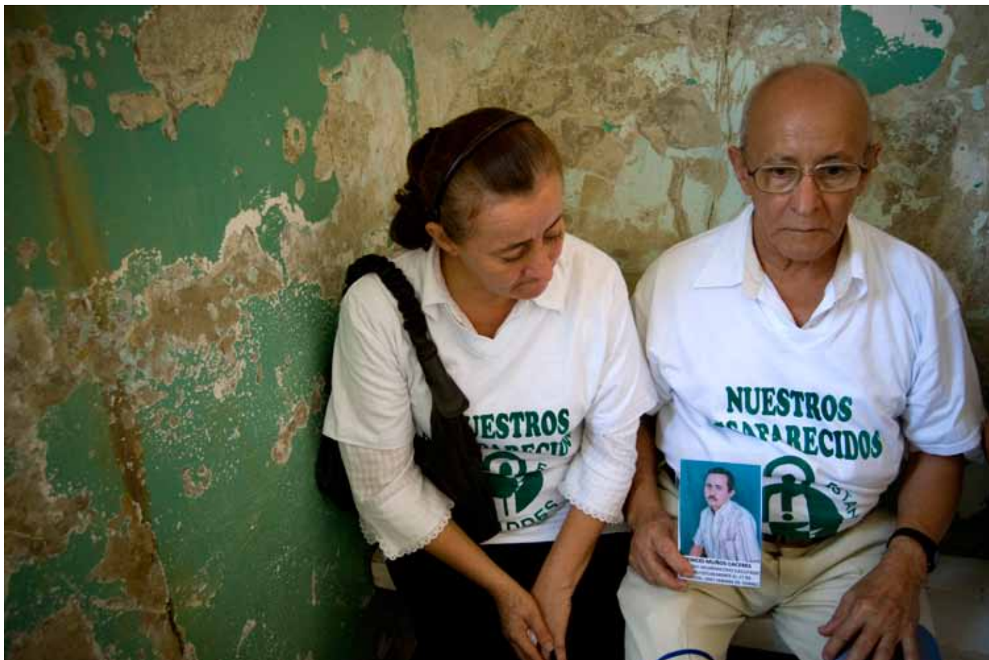
Familiares de una víctima desaparecida en 1994 esperan en el hospital donde les entregan el cuerpo.

y por la organización de las víctimas, ya no solamente de los familiares de los desaparecidos sino por las víctimas de los crímenes de Estado» 3 .