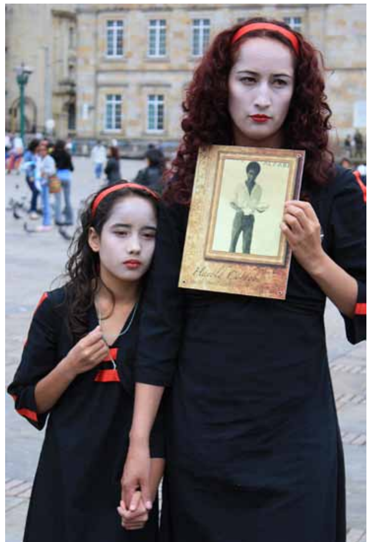
Acto contra la desaparición forzada organizado por ASFADDES en Bogotá en mayo de 2009 que conmemora la Semana Internacional de Desaparecidos.

«ASFADDES es la primera y la más antigua organización de víctimas que existe en el país. Somos los familiares de los desaparecidos agrupados para trabajar por la Verdad, la Justicia y la Reparación integral. Dentro de esa justicia trabajamos por el seguimiento a los casos