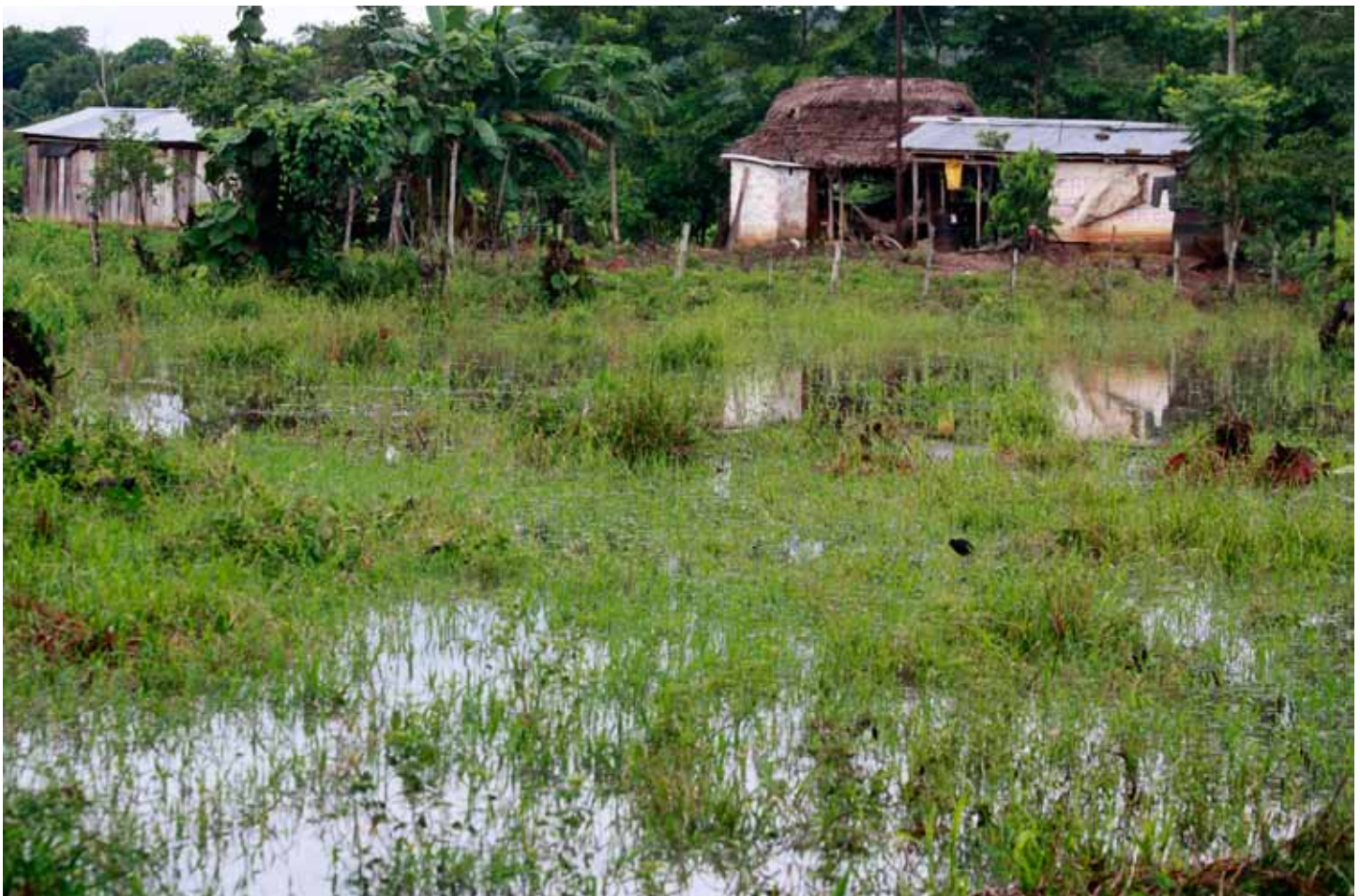
La zona rural del Valle del Río Cimitarra. CREDHOS también enfoca su labor en la promoción de los derechos humanos, derechos económicos, sociales y culturales (DESC).

La situación de derechos humanos sigue crítica en la región. La Defensoría del Pueblo enfatiza que «durante los últimos meses ha sido de conocimiento público la intensificación de las amenazas y hostigamiento contra defensoras y defensores» 13 . Destaca que «el principal escenario de riesgo [...] continúa siendo la presencia de las nuevas estructuras armadas ilegales emergidas con posterioridad a la desmovilización de las autodefensas». Se refiere a «Los Rastrojos» y «Los Urabeños», grupos que según este informe están en una disputa territorial «por el control de la economía lícita e ilícita de la región del Magdalena Medio, de las rutas del narcotráfico (puertos de embarque, transporte de precursores químicos y derivados de la coca), el lavado de dinero, el cobro de extorsiones y el hurto de combustible» 14 .