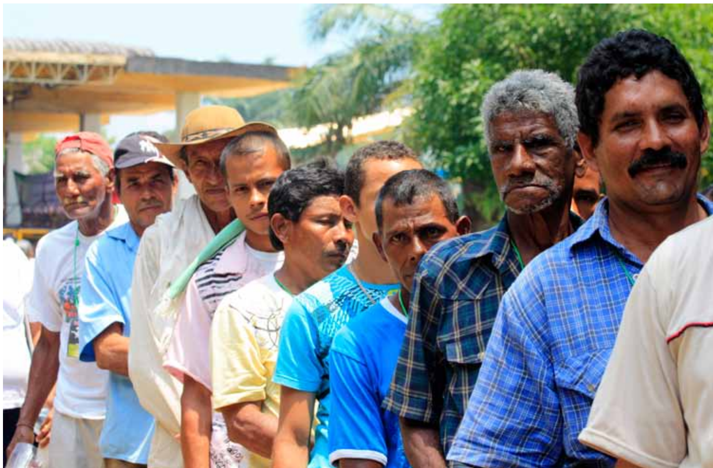
Campeños del Magdalena Medio en la celebración del bicentenario en Barrancabermeja.