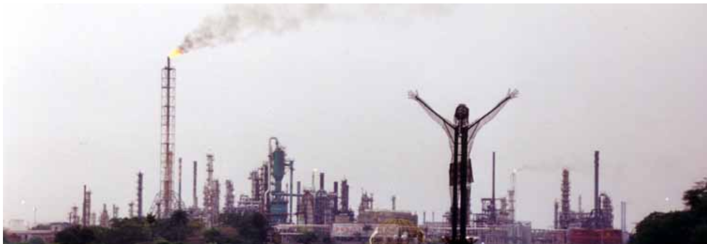
Barrancabermeja es una ciudad petrolera.