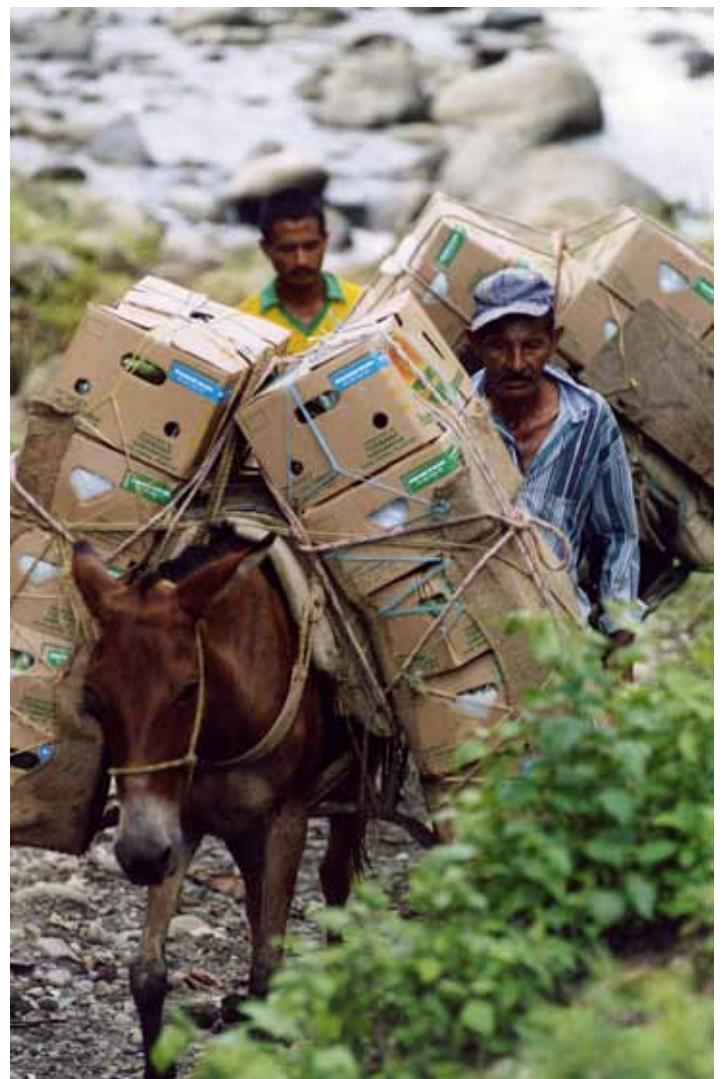
Miembros de la Comunidad de Paz transportando cajas de banano para la exportación.

Hasta la fecha ha habido poco progreso en la investigación y sanción de las personas acusadas de haber cometido crímenes contra la Comunidad de Paz. A raíz de una historia de masacres, desapariciones, ejecuciones extrajudiciales, crímenes sexuales, y desplazamientos forzados, en 2005 la Comunidad de Paz suspendió el diálogo con el gobierno colombiano hasta que este cumpla con varias condiciones 4 .