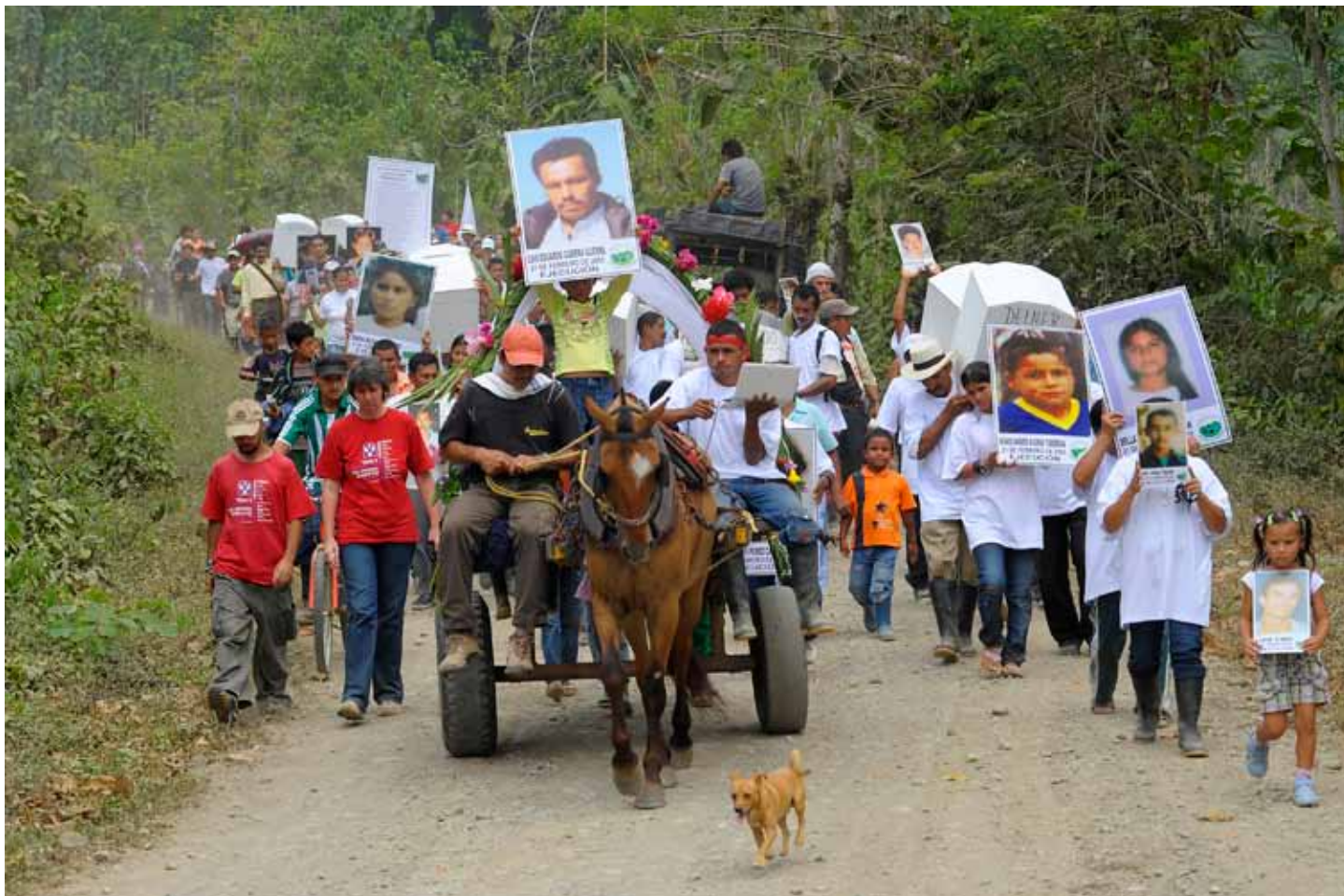
Caminata conmemorativa de los cinco años de la masacre de 2005 en la Comunidad de Paz de San José de Apartadó, febrero de 2010.

Mujeres y hombres campesinos de San José de Apartadó se declararon como Comunidad de Paz el 23 de marzo de 1997 ante las múltiples agresiones perpetradas por los actores armados del conflicto colombiano. En ese camino de paz, la Comunidad ha sido acompañada por Peace Brigades International desde 1999.