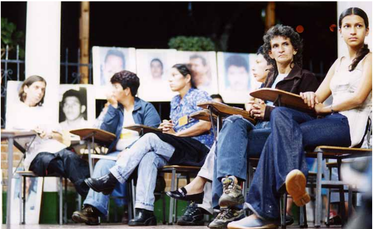
Acto contra la desaparición forzada.