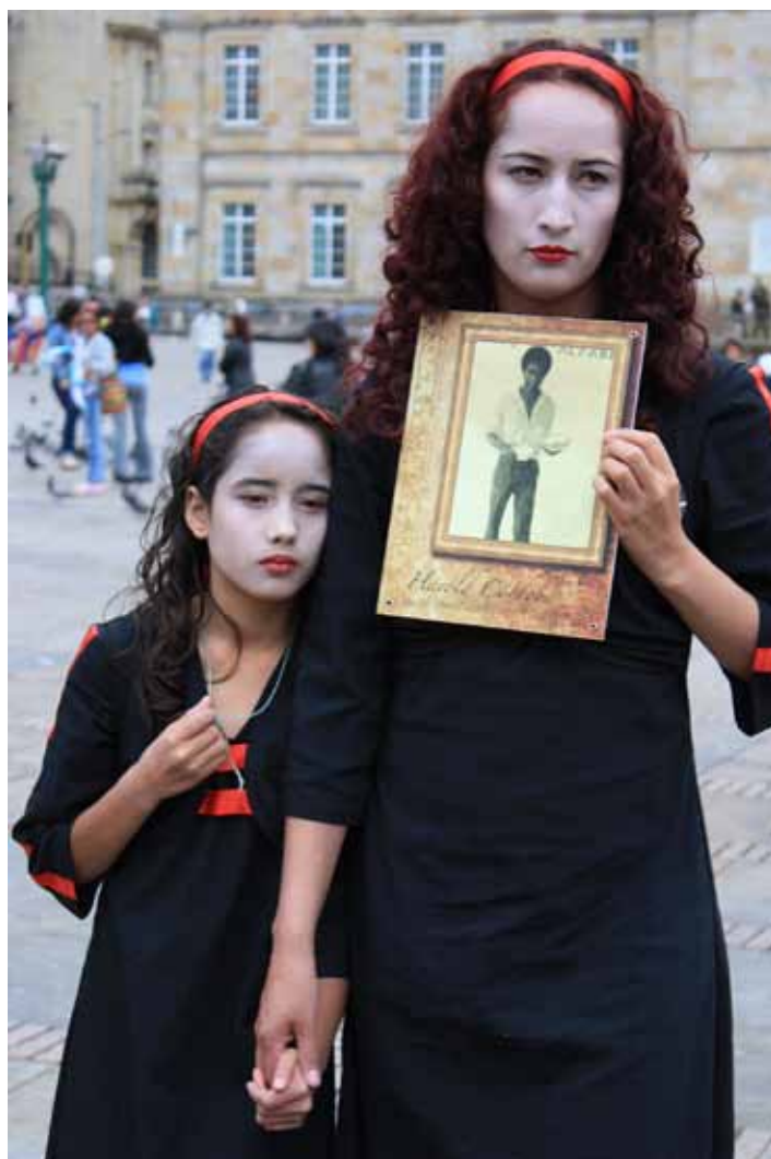
Acto contra la desaparición forzada organizado por ASFADDES en Bogotá en mayo de 2009 que conmemora la Semana Internacional de Desaparecidos.

«ASFADDES es la primera y la más antigua organización de víctimas que existe en el país. Somos los familiares de los desaparecidos agrupados para trabajar por la Verdad, la Justicia y la Reparación integral. Dentro de esa justicia trabajamos por el seguimiento a los casos