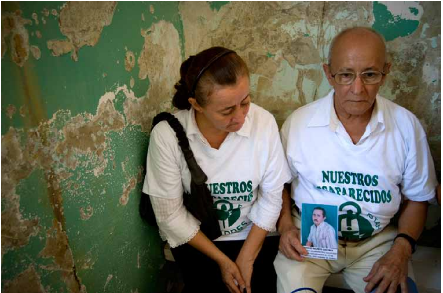
Familiares de una víctima desaparecida en 1994 esperan en el hospital donde les entregan el cuerpo.

y por la organización de las víctimas, ya no solamente de los familiares de los desaparecidos sino por las víctimas de los crímenes de Estado» 3 .