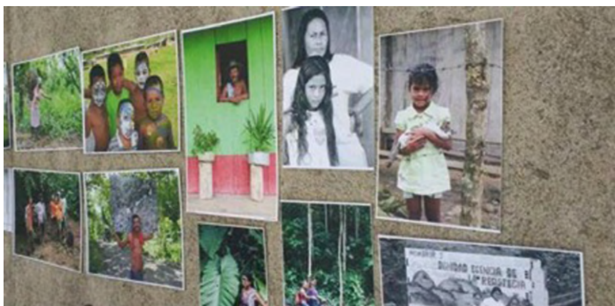
Imagen de la exposición del fotógrafo colombiano Jesús Abad Colorado en la Comunidad de Paz de San José de Apartadó en el Urabá Antioqueño, a propósito de los 20 años de fundación de la comunidad.

Este testimonio fue escrito por una mujer miembro de este corregimiento en el Urabá Antioqueño que se fundó en medio de la violencia en 1997. En él cuenta la historia de resistencia de esta comunidad que hoy cumple 20 años.