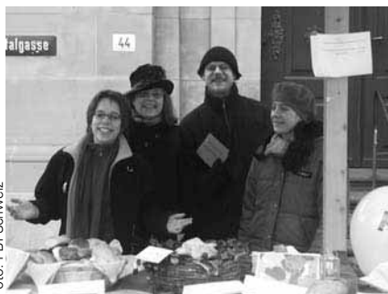
Die Regionalgruppe Bern-Fribourg engagiert sich am 10. Dez., Internationaler Tag der Menschenrechte, mit selbstgebackenen Zopftauben für den Frieden.

PBI-Freiwillige brauchen viele Talente. Ausdauer, Offenheit, kreatives Back- und Verkaufstalent waren von der Regionalgruppe Bern gefragt, als sie ihre Aktionsidee zum 10. Dezember – geboren an einer sommerlichen Sitzung – in die Tat umsetzen wollte. Eine Standaktion à la PBI: Zopftauben für den Frieden wurden gebacken und verkauft. In Bern entzündet, sprang der Funke über nach Zürich. Mit Ofenhitze gebacken, wurden die Tauben in winterlicher Kälte vor der Heiliggeistkirche verkauft. «PBI nicht Amnesty International », erklärte man den PassantInnen, die mit gratis Postkarten angelockt wurden. Gute Gespräche beflügelten Verkaufende und KundInnen. Im Schein von Windlichtern und zeitweiliger Unterstützung aus dem Fribourger-Büro verkauften die Eifrigen gegen 18 Uhr die letzte Taube und brachten auch noch einige farbige Schreibkarten an die Frau. Am Abend blieben Erinnerungen an interessante Begegnungen, leere