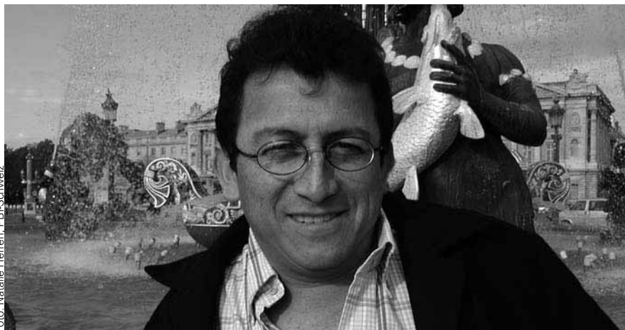
«Ich wusste, dass man mich im schlimmsten Fall hätte töten können.»

Das von ASFADDES publizierte Buch « Colombia, veinte años de historia y lucha » kann auf Seite 16 bestellt werden.