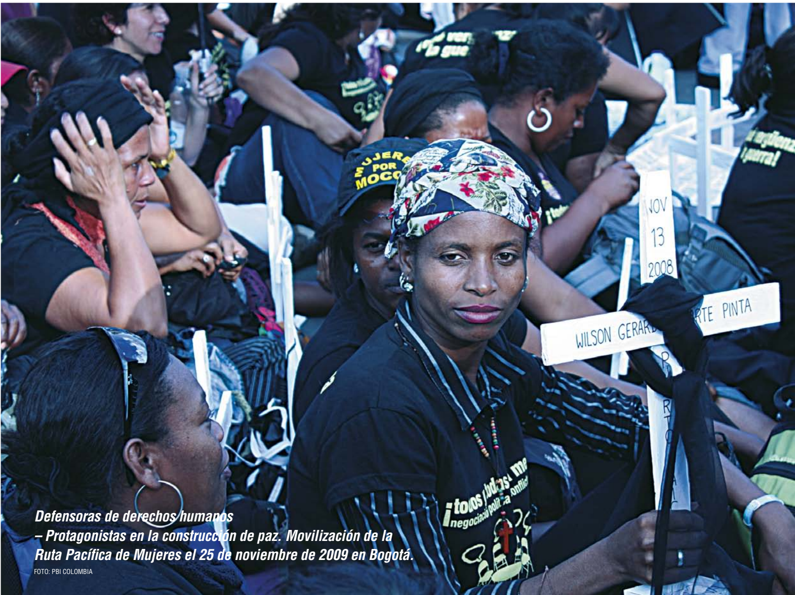
Defensoras de derechos humanos – Protagonistas en la construcción de paz. Movilización de la Ruta Pacífica de Mujeres el 25 de noviembre de 2009 en Bogotá.