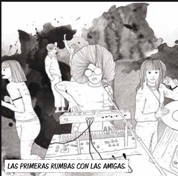
LAS PRIMERAS RUMBAS CON LAS AMIGAS.