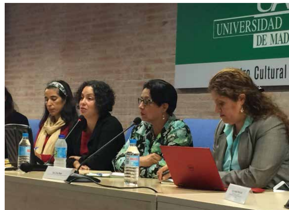
Imagen del seminario «Tejiendo redes para la protección de mujeres defensoras».

La segunda mesa trabajó sobre la Resolución 1325 y la protección de las mujeres en los conflictos armados y en las situaciones posbélicas . La aprobación en octubre del año 2000 por el Consejo de Seguridad de la ONU de la Resolución 1325 sobre mujeres, paz y seguridad supuso un punto de inflexión en la inclusión de las mujeres y la perspectiva de género en los esfuerzos de la