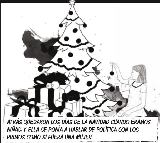
ATRÁS QUEDARON LOS DÍAS DE LA NAVIDAD CUANDO ÉRAMOS NIÑAS, Y ELLA SE PONÍA A HABLAR DE POLÍTICA CON LOS PRIMOS COMO SI FUERA UNA MUJER.