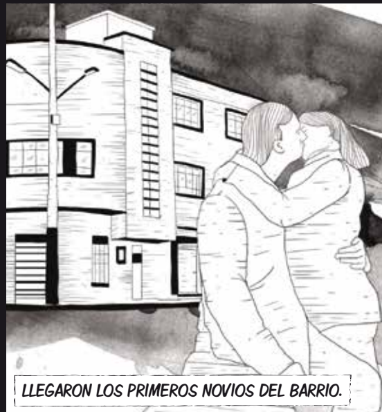
LLEGARON LOS PRIMEROS NOVIOS DEL BARRIO.