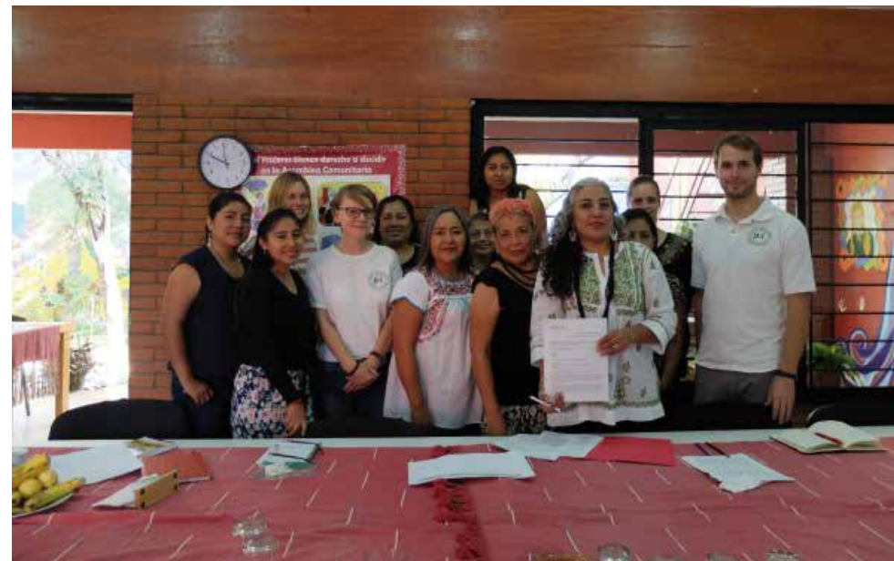
Firma del convenio de acompañamiento entre PBI México y Consorcio. Oaxaca.

Consortio ha ido enfrentando una serie de ataques. Ha sido también un proceso de ataques definido a partir de los perfiles, a partir del tipo de trabajo que hacemos, a partir de las agendas y problemáticas que tenemos abiertas. Muy preocupantes fueron los dos allanamientos que hubo en octubre de 2011 y en marzo de 2012. Fueron allanamientos muy cercanos, y que nos pusieron a la vista el hecho de que nos quieren atacar. Pero si nosotros lo que hacemos es denunciar feminicidios y violencia contra las mujeres, ¿a quién le puede afectar? Estos fueron