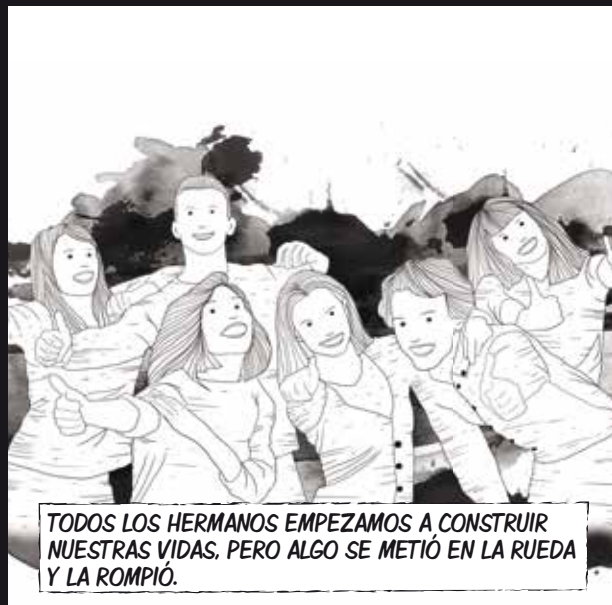
TODOS LOS HERMANOS EMPEZAMOS A CONSTRUIR NUESTRAS VIDAS, PERO ALGO SE METIÓ EN LA RUEDA Y LA ROMPIÓ.