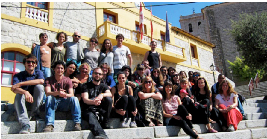
Imagen de un momento del encuentro de formación de PBI Colombia en mayo 2015 en Valladolid

A lo largo de 2015, quince personas del Estado español han formado parte de los equipos de PBI. Dos de ellas estuvieron en el equipo de Honduras, otras dos en México, seis en Colombia y cinco en Guatemala. El encuentro de formación para integrar el equipo de PBI en Colombia tuvo lugar en Valladolid y el del proyecto de México en Barcelona.