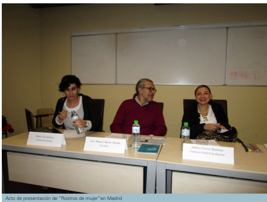
Acto de presentación de "Rostros de mujer" en Madrid