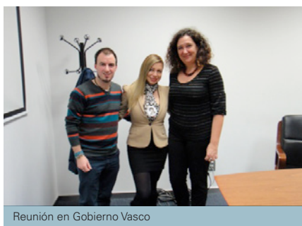
Reunión en Gobierno Vasco

Andrea visitó Barcelona, Bilbao, Donostia, Madrid, Santander y Vitoria-Gasteiz, donde mantuvo reuniones con el Ministerio de Asuntos Exteriores y Cooperación (MAEC) y el Intergrupo de Derechos Humanos del Congreso de los Diputados. También se reunió con autoridades locales y autonómicas, colectivos de abogados, agencias de cooperación y ONG que dan seguimiento a la situación de Derechos Humanos (DDHH) en Colombia. Se realizaron tres actos públicos de sensibilización y difusión y varias entrevistas en medios de comunicación.