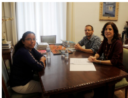
Reunión en la Diputación de Córdoba

más emblemáticos que representa, como las desapariciones en torno a la toma del Palacio de Justicia en 1985, el asesinato de varios miembros (menores de edad incluidos) de la Comunidad de Paz de San José de Apartadó en 2005 o casos de ejecuciones extrajudiciales. También se abordó la situación de impunidad que rodea a casos de graves violaciones a los derechos humanos en Colombia.