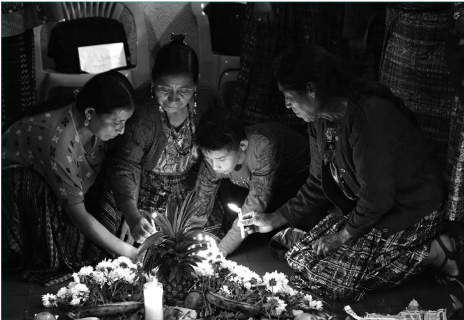
CONAVIGUAREN 25. urteurreneko zeremonia maia, Guatemalako hiria