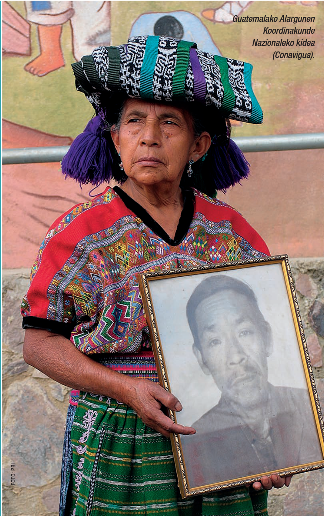
Guatemalako Alargunen Kordinakunde Nazionaleko kidea (Conavigua).