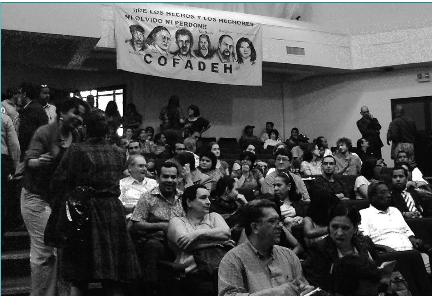
Cofadehk 30. urteurrena ospatu zuen