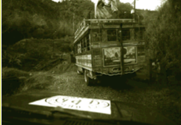
PBI biedt bescherming in Colombia middels een speciale PBI-auto.

gevangenisstraffen voor mensenrechtenactivisten, vakbondsleiders, maar bijvoorbeeld ook medici die in conflictzones werken of docenten met linkse sympathieën, zijn in Colombia een bekende methode om ongewenste oppositie monddood te maken. En het is meer dan eens gebeurd dat degenen die wegens gebrek aan bewijs weer op vrije voeten kwamen te staan, onder druk van bedreigingen door paramilitairen naar andere delen van het land of naar het buitenland hebben moeten uitwijken. Sommigen zijn vermoord. Want wie eenmaal als vijand van het systeem is gebrandmerkt en getraceerd is door de paramilitaire netwerken – en de lijnen tussen ‘paras’ binnen en buiten de gevangenis zijn kort – is zijn leven niet meer zeker.