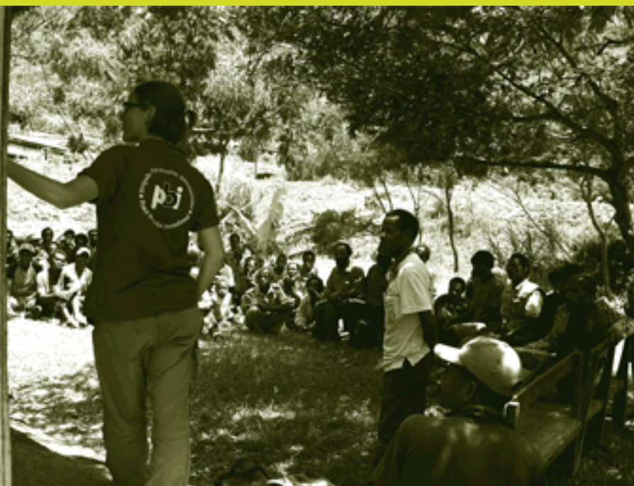
PBI verzorgt een workshop in Indonesië.

Het PBI-team in Atjeh richt zich op post-tsunami-steun aan lokale organisaties. De activiteiten omvatten naast beschermende begeleiding ook vredeseducatie. Opmerkelijk is dat twee leden van dit team de Indonesische nationaliteit hebben. Er zijn momenteel geen Nederlanders namens PBI actief in Atjeh.