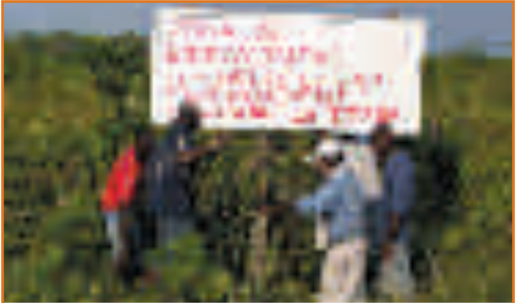
Humanitaire zones worden met borden en omheiningen gemarkeerd.