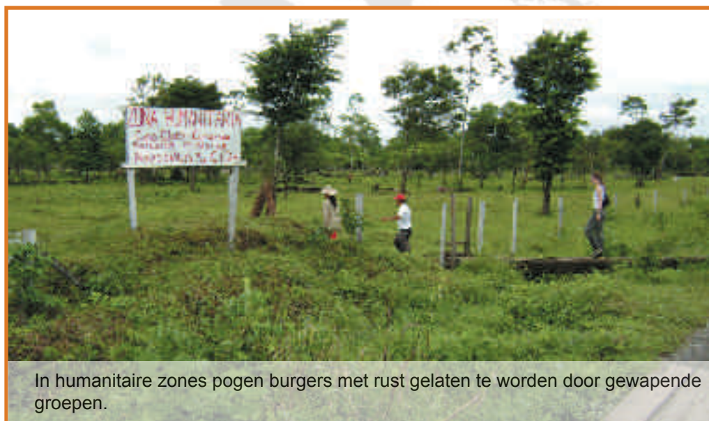
In humanitaire zones pogen burgers met rust gelaten te worden door gewapende groepen.