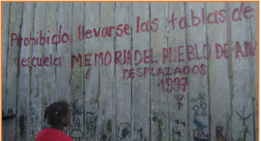
Op een schoolgebouw staat geschreven dat het gebouw toebehoort aan de ontheemde bevolking en dat niemand het gekapte hout mee mag nemen.