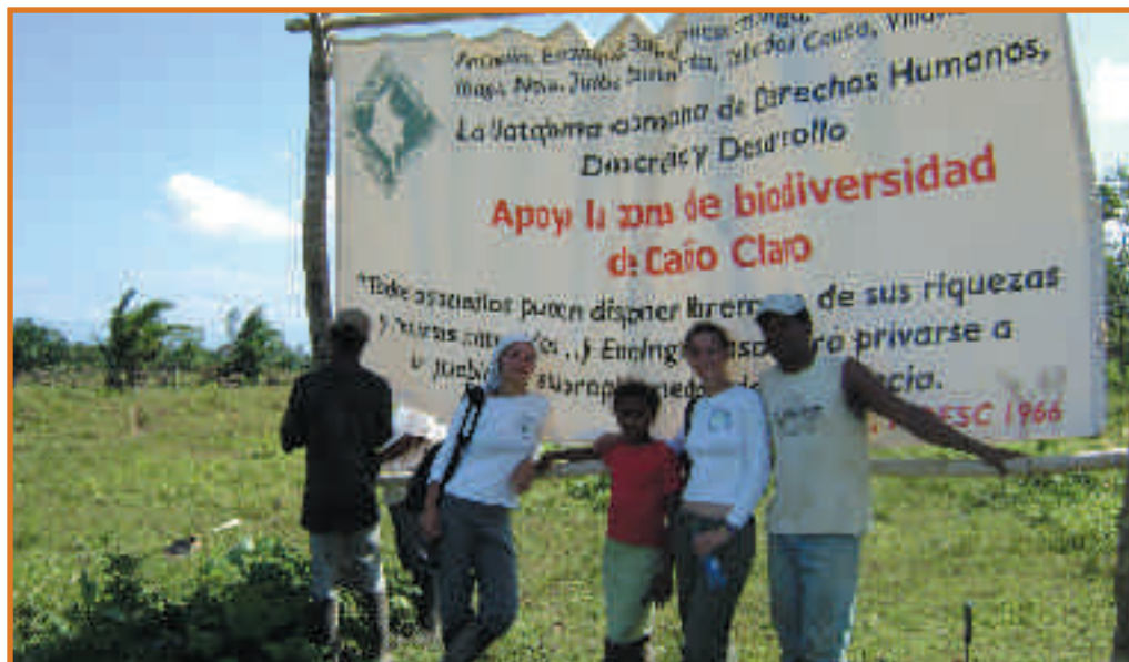
PBI-medewerkers met inwoners voor een spandoek die een Humanitaire Zone aangeeft.