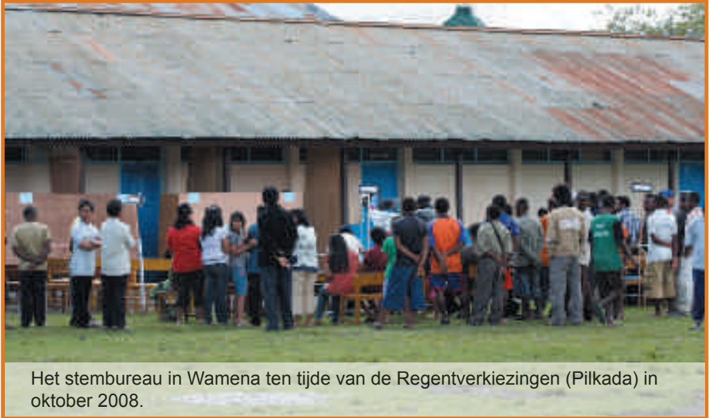
Het stembureau in Wamena ten tijde van de Regentverkiezingen (Pilkada) in oktober 2008.