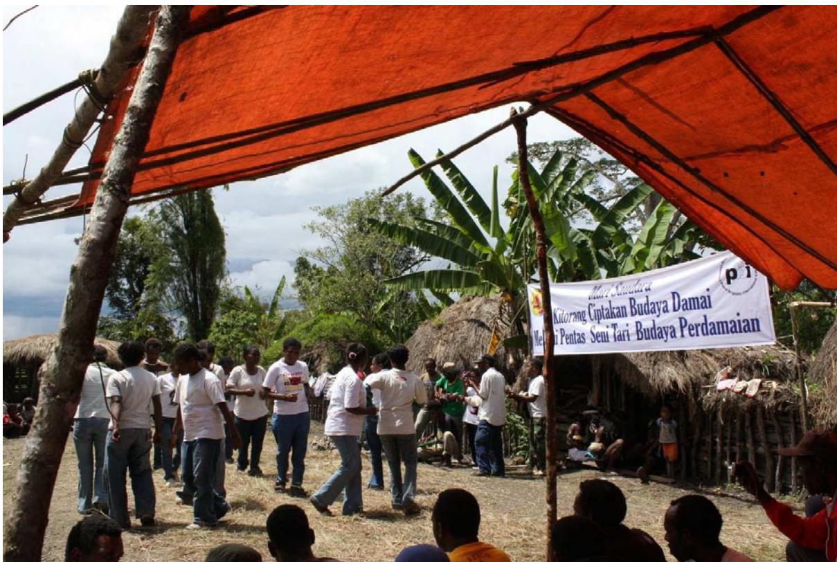
Peace dance in Indonesië

Bekendheid van PBI bij het grote publiek is achterwege gebleven. PBI heeft gekozen voor een gerichtere PR aanpak richting politiek en NGO-netwerken, in plaats van het grote, algemene publiek. Voortschrijdend inzicht over de effectiviteit en capaciteit ervan heeft het bestuur doen besluiten haar koers hierin te wijzigen.