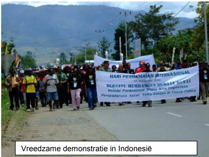
Vreedzame demonstratie in Indonesië