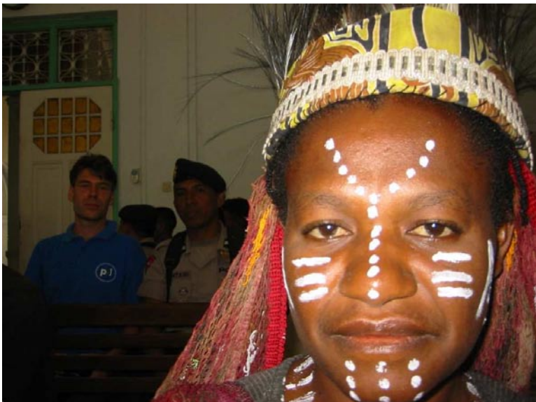
Rechtszaak in Indonesië

De leden van dit netwerk zien PBI Nederland als belangrijke partner in haar netwerk.