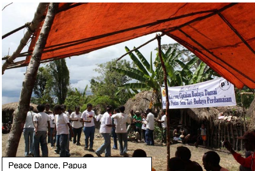
Peace Dance, Papua

Het team speelt een belangrijke rol in de proactieve strategie in Papua. Vanuit de Papua hoofdstad wordt de veiligheidssituatie van veel organisaties en individuele cliënten in de gaten gehouden. Vanwege de ingewikkelde en gevoelige veiligheidssituatie in Papua is het niet voldoende voor PBI om één soort beschermingsmechanisme in te zetten. Om de veiligheid van cliënten te verhogen en hun werkveld te vergroten wordt gebruik gemaakt van meerdere methodes. Ook de grote geografische afstanden en slechte infrastructuur vormen een extra uitdaging voor het werk in Papua en West-Papua. Er worden regelmatig meerdaagse veldtrips gehouden naar de plaatsten waar PBI cliënten wonen en werken. Door het team wordt veel geïnvesteerd in het onderhouden van contacten met autoriteiten, waaronder het kantoor immigratie dat over de speciaal voor Papua nodige reisvergunningen beslist.