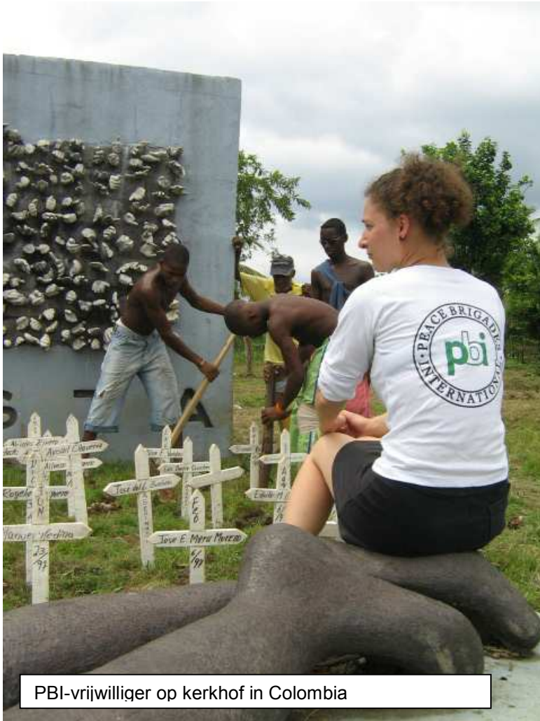
PBI-vrijwilliger op kerkhof in Colombia

PBI-NL is lid van meerdere overlegorganen op het gebied van mensenrechten, steunnetwerken, platforms en heeft regelmatig contact met het ministerie van Buitenlandse Zaken en organisaties die zich bezighouden met mensenrechten. Deze samenwerking is belangrijk voor informatie-uitwisseling maar ook in gevallen van nood.