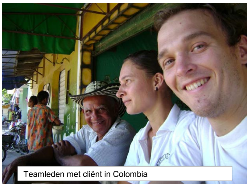
Teamleden met cliënt in Colombia

Een vredesgemeenschap van ontheemden uit Cacarica. De inwoners van deze vredesgemeenschap in het departement Chocó keerden in 2001 terug naar hervestigingskampen nadat zij in 1997 gedwongen werden hun huizen te ontvluchten. Er bestaat nog steeds angst voor aanvallen door paramilitairen. PBI heeft CIJP begeleid gedurende de verschillende fasen van het terugkeerproces en tijdens de oprichting van de humanitaire zone. PBI is nu regelmatig aanwezig in de twee nederzettingen, namelijk 15 dagen per maand per nederzetting.