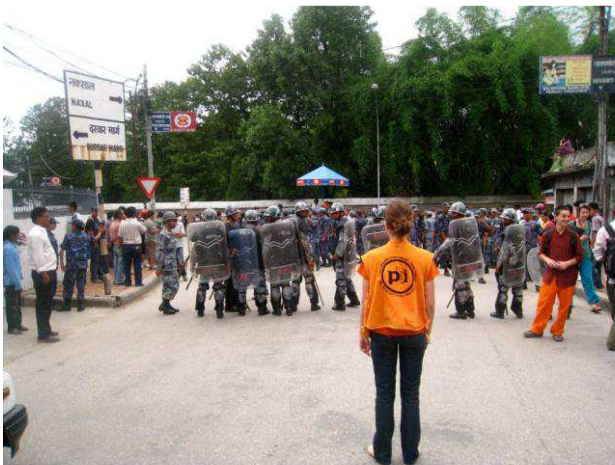
Observatie in Nepal