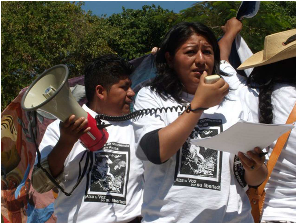
Vreedzame demonstratie in Mexico

Het ene communicatiemiddel werkt beter en is makkelijker te verwezenlijken dan het andere. We proberen zoveel mogelijk te roeien met de riemen die zij heeft waarbij we in 2008 gemerkt hebben dat we 'goed scoren' op het gebied van het enthousiasmeren van (project)vrijwilligers en minder op het gebied van donateurwerving. Dit heeft ons inziens te maken met het grote aantal ontwikkelingsorganisaties op de charitatieve markt die allen naarstig op zoek zijn naar donateurs. Een andere reden is dat we slechts een beperkt deel van haar bescheiden budget kan inzetten ten behoeve van publiciteit waardoor de organisatie dus nog steeds, ondanks haar bewezen positie, vrij onbekend is bij het grote publiek.