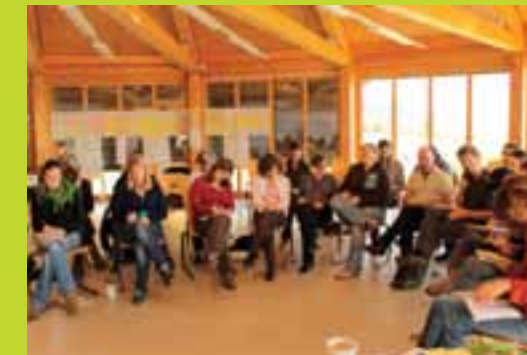
Samenkomst tijdens de Algemene Vergadering, Zwitserland.

toekomst. We blijven verbeteren en groeien, zonder daarbij uit het oog te verliezen voor wie we het uiteindelijk allemaal doen: de mensenrechtenverdedigers die in hun eigen land bedreigd worden als gevolg van het belangrijke werk dat ze doen. Met dit doel voor ogen, gaan we verder in de ruim 20 landen waar we nu actief zijn.