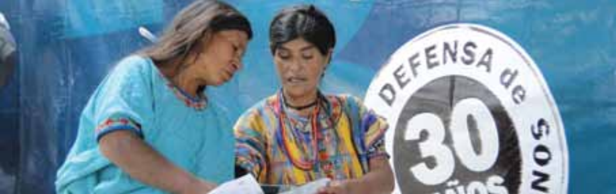
Bezoekers van een bijeenkomst ter ere van het 30-jarig bestaan van PBI, Guatemala.