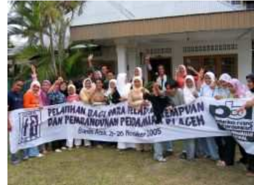
PBI Indonesia Training van Trainers over “Vrouwen en Vredesopbouw” met Flower Aceh

Het Atjeh team bestond voor het grootste deel van 2006 uit vijf mannen en vrouwen, van wie twee met de Indonesische nationaliteit. De aanvragen voor het mede organiseren van workshops blijven toestromen. PBI werkt altijd met een partnerorganisatie waarmee in samenwerking een “needs assessment” gedaan wordt met de doelgroep van de workshop. Het Atjeh team is in 2006 met zeer verschillende organisaties en doelgroepen in zee gegaan. Activiteiten varieerden van een “Peace Camp” voor middelbare schooljeugd tot workshops voor interne vluchtelingen, gericht op het verhogen van bewustzijn voor mensenrechten.