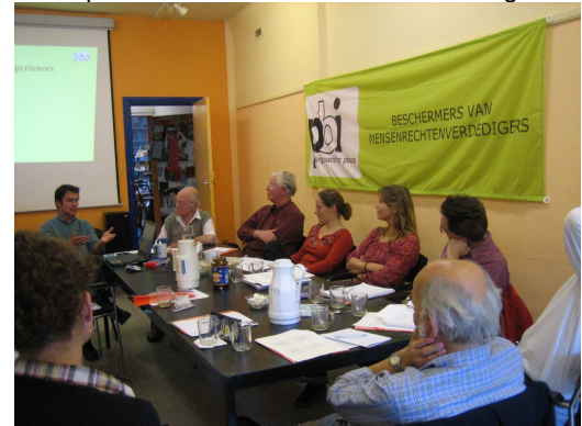
Lobbytraining door BBO aan PBI Nederland vrijwilligers september 2006

In december was er een borrel van de mensenrechtenambassadeur, PBI was ook uitgenodigd.