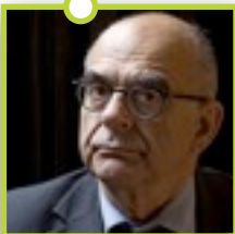
Jan Pronk , hoogleraar in Theorie en Praktijk van Internationale Ontwikkeling aan het International Institute of Social Studies in Den Haag en oud-minister van Ontwikkelingssamenwerking.

Deze column is ingekort, lees het gehele verhaal op de website www.peacebrigades.nl , onder het kopje 'Nieuws'.