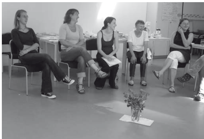
Gute Gesprächsführung lässt sich lernen: Fortbildung für MitarbeiterInnen von Freiwilligenorganisationen

als „ausländische ExpertIn“ und zu Hause ist sie eine unter vielen. Dies kann durch eine schwierige finanzielle Situation oder Arbeitslosigkeit noch verstärkt werden.