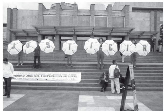
Solidaritätskundgebung von Movice im Dezember 2008