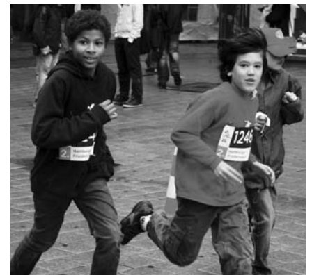
Stolze 8000 km schafften die LäuferInnen und sammelten eine Spendensumme von 28 000 Euro!