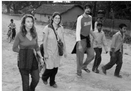
Präsenz zeigen: das Team in Gulariya

Rücktritt des Premierministers: Premierminister Pushpa Kamal Dahal (auch bekannt als Prachanda) ist Anfang Mai nach dem politischen Streit um die Entlassung des Armeechefs Katawal zurückgetreten. Der General hatte sich geweigert, die ehemaligen maoistischen Rebellen in die nepalesische Armee zu integrieren. Am 23.5. wurde Madhav Kumar Nepal zum neuen Premierminister ernannt. Der Rücktritt des Premiers nach nicht einmal einem Jahr im Amt bedeutet einen Rückschlag für den Friedensprozess in Nepal und zieht eine politische Krise nach sich. Die politische Situation ist von gewalttätigen Protesten geprägt. Im Sommer wurden die Sitzungen des Parlaments für zwei Monate unterbrochen.