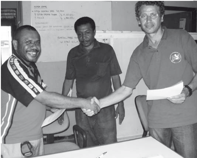
Auf gute Partnerschaft: ein Handschlag besiegelt die künftige Begleitung