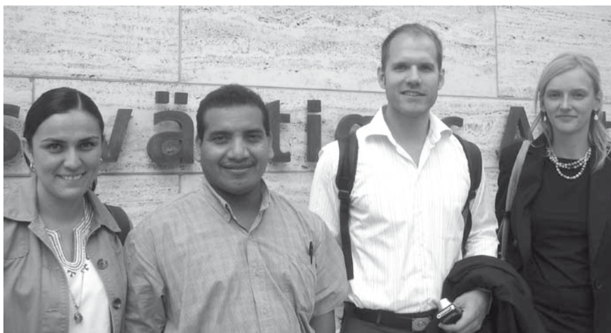
Nach dem Gespräch im Auswärtigen Amt Berlin

Es gibt in Guerrero nur zwei unabhängige Zeitungen, die kritisch über das Thema Menschenrechte berichten. Alle anderen Zeitungen werden vom Staat kontrolliert. Die beiden kritischen Medien werden durch staatliche Stellen kriminalisiert. In der bundesweiten