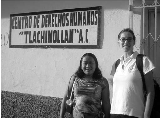
pbi-Besuch im Büro des Menschenrechtszentrums Tlachinolán, das jetzt geschlossen wurde

Kritische Lage für MenschenrechtsverteidigerInnen im Süden Mexikos