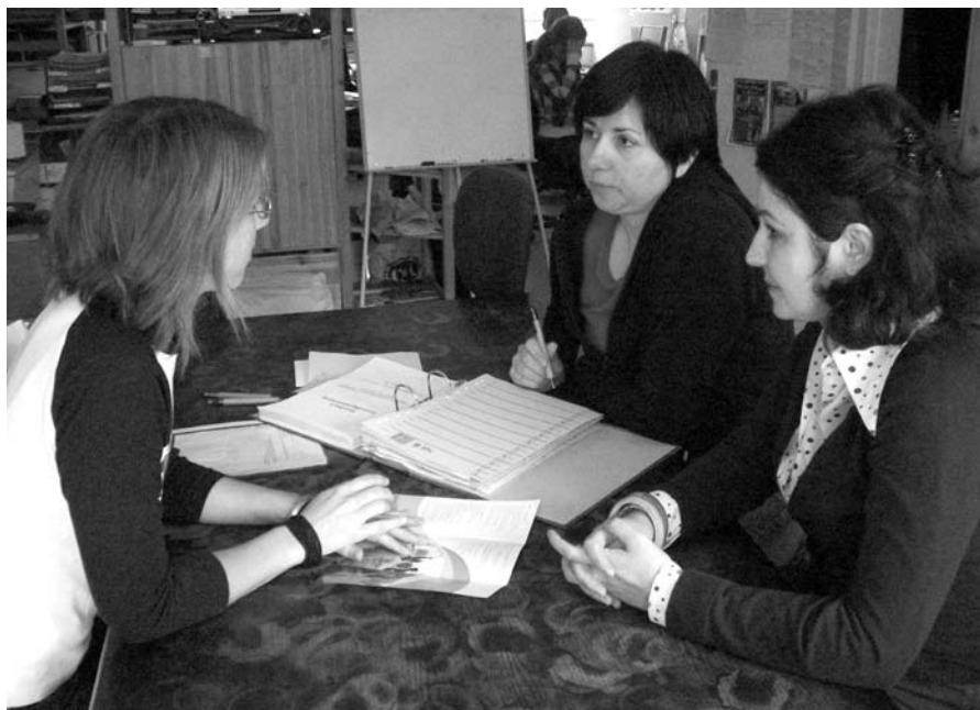
Die pbi-Arbeitsgruppe Freiwilligenbegleitung hat schon viel erreicht. Schwerpunkt in diesem Jahr ist der Ausbau eines Patensystems für Freiwillige.

Ein wichtiger Aspekt besteht in der persönlichen Verarbeitung der Erlebnisse. Ein anderer wichtiger Aspekt ist die Integration der vielen Erlebnisse