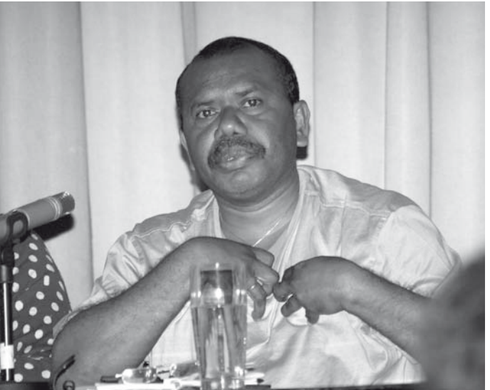
Vortrag während des Besuchs in Deutschland