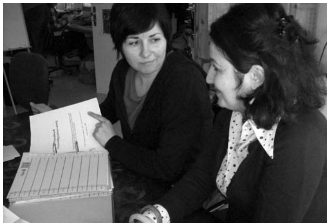
An den Konzepten zur Freiwilligenbegleitung wird intensiv gearbeitet

pbi gibt Hilfestellung durch Auswertungs- und Beratungsgespräche und vermittelt bei Bedarf weitergehende Unterstützung, zum Beispiel durch PsychologInnen, denen die Besonderheiten eines Freiwilligendienstes gut bekannt