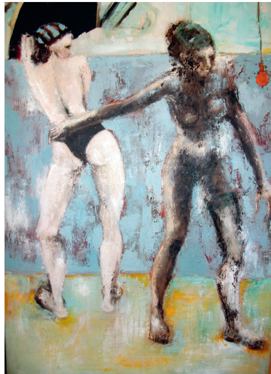
Dana Peinert, Metamorphosis 80x70cm, Öl auf Leinwand