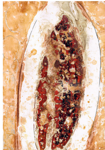
Zsolt S. Deák, ohne Titel 40x30 cm, gerahmt, passepartoutiert