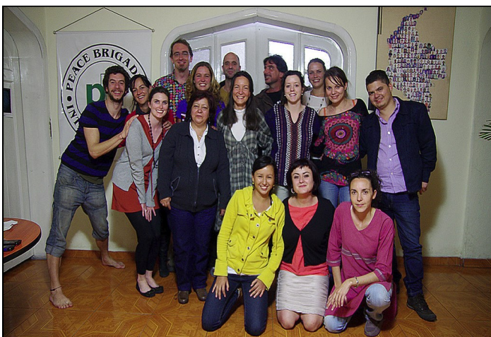
Les nouveaux volontaires posent lors de leur arrivée sur le terrain au sein de PBI Colombie.

Une partie du travail de volontaire consiste en l'accompagnement physique des défenseurs sur le terrain, dans une perspective de dissuasion face aux acteurs parties au conflit. Une autre composante importante, et qui permet de renforcer cette dissuasion, est l'accompagnement politique, c'est-à-dire le plaidoyer auprès des autorités locales, tant civiles que militaires, à différents niveaux de hiérarchie, en faveur de la protection des organisations accompagnées. Enfin, un autre aspect fondamental du travail mené en tant que volontaire de terrain réside en l'accompagnement émotionnel des défenseurs face aux nombreuses menaces et agressions qu'ils subissent du fait de leur engagement.