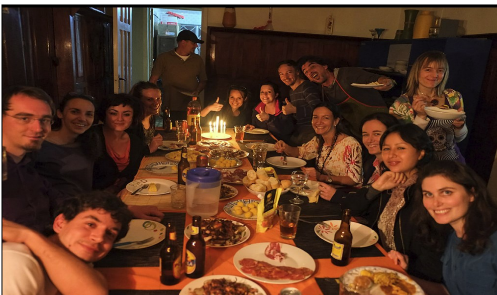
Les volontaires du projet Colombie lors d'une soirée à la maison des volontaires à Bogota.

à ce que je choisisse par la suite de travailler en faveur des droits de l'Homme. Après quelques années passées à Paris, j'ai souhaité renouer de manière plus directe avec la Colombie. Ayant une bonne connaissance, de par mon activité professionnelle précédente, des