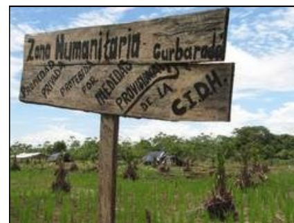
Entrée d'une Zone humanitaire, dans le Curbarado.