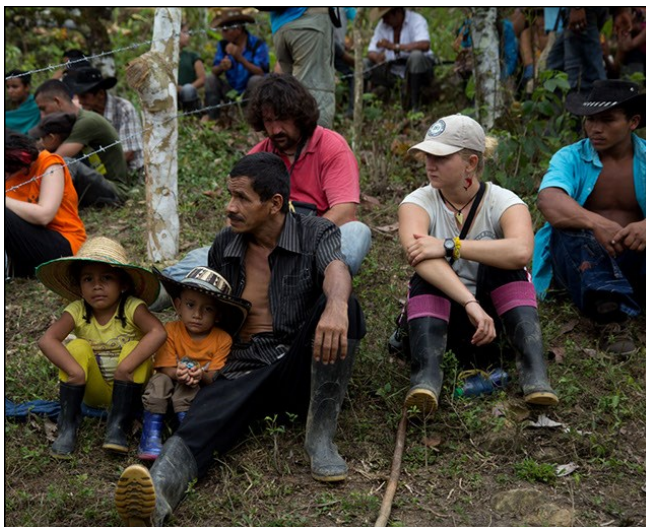
PBI est aux côtés des défenseurs qui luttent contre les mégaprojets affectant leur terres ancestrales.

égale en mettant en place des dispositifs de régulation de la concurrence. En réalité, ces principes sont rarement connus des mineurs eux-mêmes, et finalement peu appliqués. De plus, la réforme de ce code oblige les mineurs à enregistrer leur activité et, en cas d'activité sur une terre déjà sous licence pour le compte d'un grand groupe, à « passer un accord » avec ce groupe, ce qui signifie le plus souvent le partenariat, la vente ou l'abandon de leur parcelle d'activité. Le blocage de cette réforme a gelé les enregistrements de petites activités; aujourd'hui, 70% des mineurs, petits extracteurs indépendants, n'ont pas de licence.