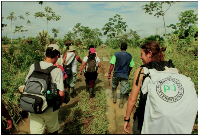
PBI accompagne la CIJP sur le terrain depuis 1994.

D epuis plus de 20 ans, la Commission inter-ecclésiale Justice et Paix (CIJP) accompagne des communautés et organisations afro-descendantes, indigènes et métisses situées dans des zones de conflit armé qui veulent faire valoir leurs droits sans recourir à la violence. L'accompagnement de la CIJP peut être qualifié d' "intégral" puisque cette ONG les soutient tant sur le plan humanitaire et logistique que sur les aspects juridiques, pédagogiques et psychologiques.