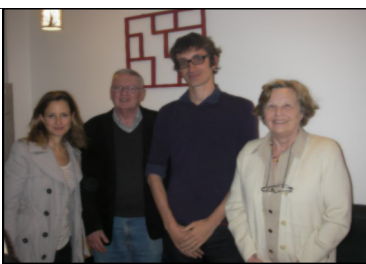
Les membres du Bureau de PBI France.

Lors de l'Assemblée Générale de PBI France, le 29 mars 2014, un nouveau Bureau a été élu. Il se compose comme suit :