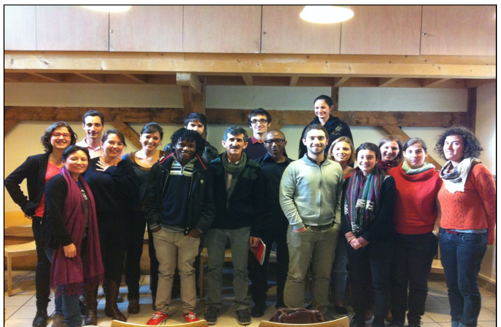
Les deux défenseurs ont rencontré des futurs volontaires lors d'une Journée d'initiation de PBI France.