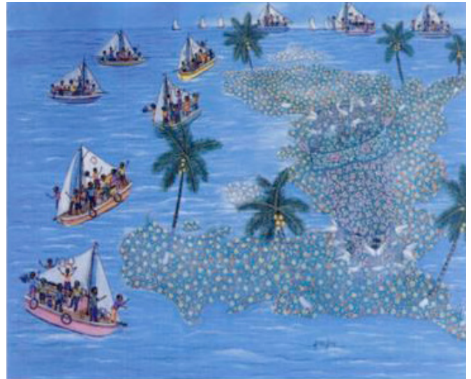
Illustration du livre écrit par d'anciens volontaires de PBI en Haïti, « Expériences non violentes en Haïti » (éditions Karthala, 2001)

En 1999, au moment des bombardements de l'OTAN sur des cibles serbes, et le déplacement massif des Kosovars albanais par l'armée serbe, la question de l'avenir du projet se pose pour des raisons de sécurité, mais considérant que l'encouragement des initiatives de dialogue entre les sociétés civiles albanaise et serbe est essentiel à la fin du conflit, Balkan Peace Team choisit de rester. Le projet ferme en mars 2001 à la suite d'un manque de ressources. L'ONG française « Equipe de Paix des Balkans » a repris le flambeau dans le travail de dialogue entre les sociétés civiles et de formation à la non-violence.