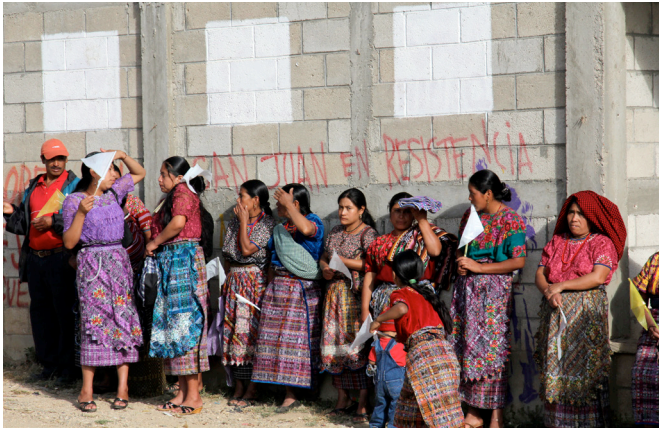
Résistance pacifique des communautés de San Juan Sacatepéquez

AU COURS DES TROIS DERNIÈRES DÉCENNIES, LES ÉQUIPES DU PROJET GUATEMALA SE SONT SUCCÉDÉES POUR OEUVRER AU SERVICE DE LA PAIX ET DE LA DÉFENSE DES DROITS HUMAINS DANS LE PAYS. CET ARTICLE REVIENT SUR LES PRINCIPAUX ÉVÈNEMENTS QUI ONT JALONNÉ LA VIE DU PROJET.