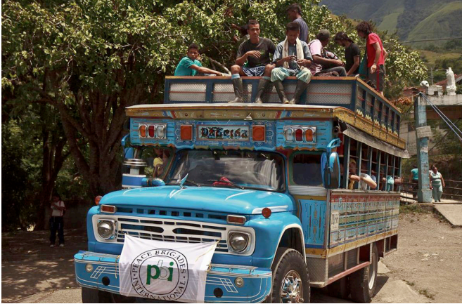
Accompagnement d'un rassemblement de leaders communautaires à El Balsita, Antioquia, afin d'organiser la résistance face au conflit armé et à la dépossession des terres, 2012