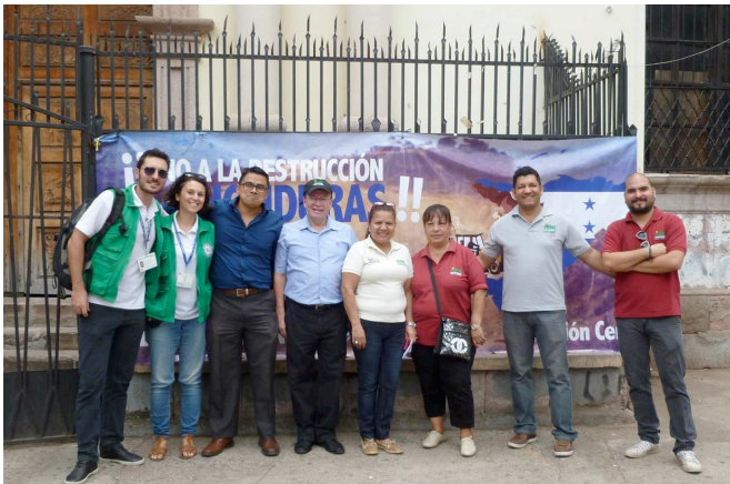
Accompagnement du CEHPRODEC au congrès national pour s'opposer à un projet minier, août 2015

Octobre 2013. Les premiers volontaires de PBI arrivent au Honduras. Après le Guatemala, pays d'intervention « historique » pour PBI, c'est le second pays d'Amérique centrale à voir s'installer un bureau de PBI. Il aura fallu deux missions exploratoires, en 2011 et 2012, pour que l'organisation se décide à s'établir dans le pays, après des dizaines d'entretiens avec des défenseurs des droits humains locaux et une analyse poussée de la pertinence et de l'adaptation de la méthodologie de PBI au contexte de ce petit pays d'Amérique centrale.