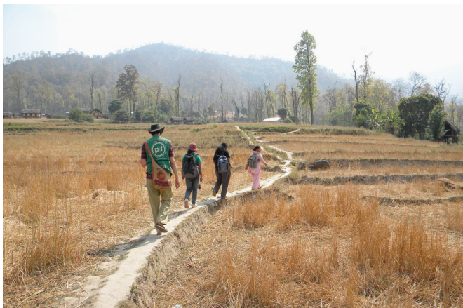
Accompagnement de défenseurs népalais, 2010

En 2005, PBI débutait son travail au Népal, alors que le pays commençait tout juste à sortir de dix ans d'une guerre civile qui avait causé la mort de plus de 13 000 personnes et fait environ 1 500 disparu(e)s. Tandis que les acteurs nationaux et internationaux se concentraient sur la conclusion d'un accord de paix et la fin de l'instabilité politique du pays, les victimes de violations de droits humains de la part des deux parties au conflit, les rebelles maoïstes et l'armée royale, attendaient eux que justice leur soit rendue. Les Népalais qui combattaient l'impunité ou tentaient de faire évoluer les normes sociales et culturelles du pays en faveur d'un plus grand respect des droits humains étaient particulièrement vulnérables et faisaient face à de nombreuses menaces : la pertinence d'un travail d'accompagnement protecteur de la part d'une organisation internationale comme PBI a donné lieu à l'ouverture d'un bureau à Katmandou, la capitale, et à Bardiya, dans le sud-ouest du pays.