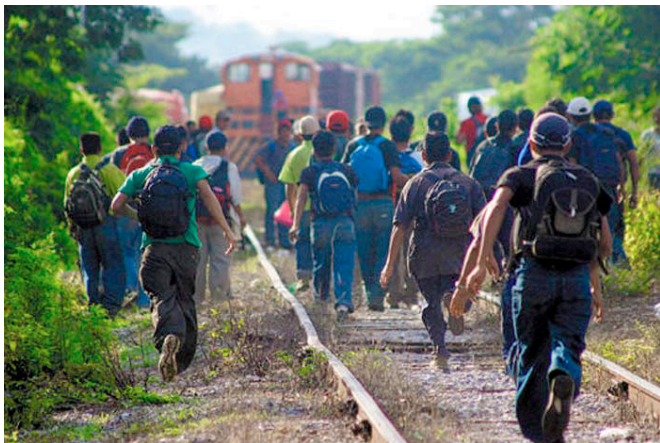
Les migrants centroaméricains traversent le Mexique sur « la bestia », un train de marchandise dont la moindre chute peut être mortelle