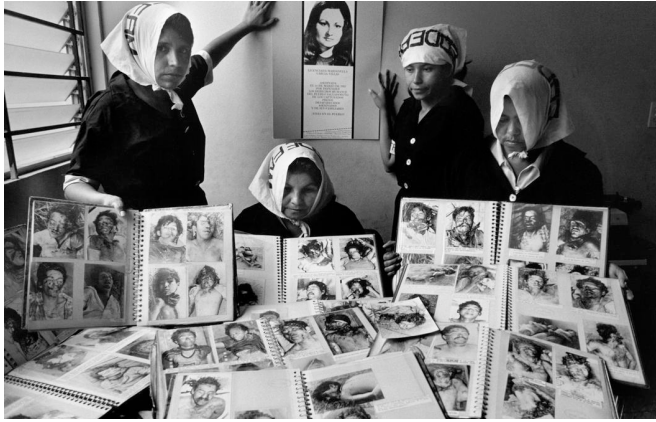
Les mères de disparus de l'organisation COMADRES