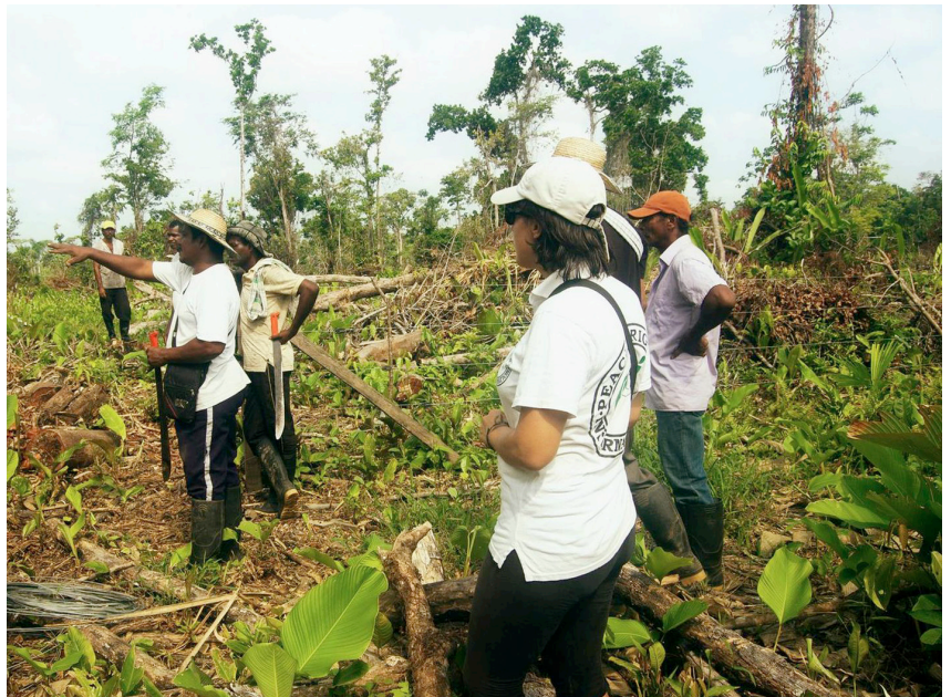
Accompagnement d'une communauté afro-colombienne dans le Chocó, 2014

La présence des volontaires de PBI aura-t-elle toujours un sens ? La question s'adressera aux défenseurs que nous accompagnons car, même si notre objectif est à terme de pouvoir quitter la Colombie, c'est la société civile qui a sollicité notre présence et c'est cette même société civile qui devrait nous décharger de notre mission. De toute façon, lorsque nous pensons nous approcher de la fin du chemin, nous nous rendons compte que nous ne sommes qu'au début.