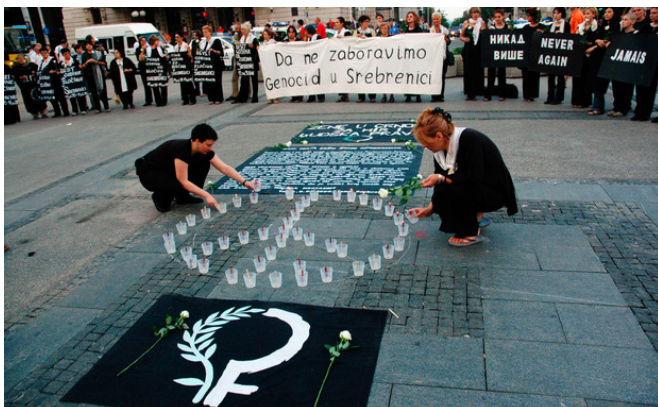
Commémoration du génocide de Srebrenica, organisée par l'organisation pacifiste Women in Black à Belgrade

En 1993, plusieurs organisations internationales, dont PBI, reçoivent des demandes d'accompagnement international de la société civile en Croatie et au Kosovo. En juin 1993, la coalition « Balkan Peace Team International » (BPT-I), est créée par des volontaires internationaux afin de recréer des liens entre les communautés croates, bosniaques, serbes et albanaises, faciliter l'émergence d'une société civile, accompagner les organisations locales de droits humains et promouvoir la paix. Il s'agit de créer un pont entre des organisations pour la paix dans les différentes communautés, aidant l'information à circuler à l'intérieur et à l'extérieur de la région. Balkan Peace Team est composé de diverses organisations dont des organisations internationales comme PBI et des organisations françaises telles que le Mouvement pour une Alternative Non violente (MAN). Balkan Peace Team travaille auprès de la société civile, coopérant et encourageant le développement d'ONG, mais également dans le plaidoyer, soutenant des militants des droits humains et fournissant une présence internationale protectrice, lors de procès ou dans les camps de réfugiés.