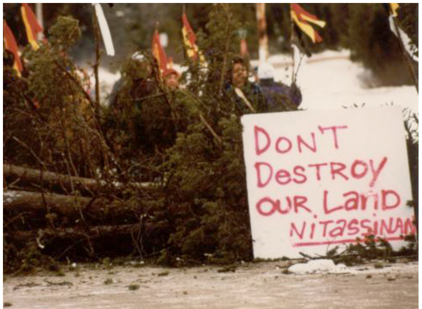
Manifestation d'Innu pour la sauvegarde de leur territoire en 1993, dans le Labrador, Québec

Le projet de PBI au Québec est né des éruptions de violence entre les communautés Mohawks et les autorités locales québécoises en 1990. Jusqu'en 1999, PBI envoie des équipes à court terme comme observateurs internationaux lors des actions de résistance amérindiennes. Par ailleurs, des communautés Innues, Chippewas, Shoshone sont accompagnées lors de négociations avec les autorités canadiennes et américaines, notamment autour du projet d'un barrage pour alimenter en électricité le Nord-Est des USA.